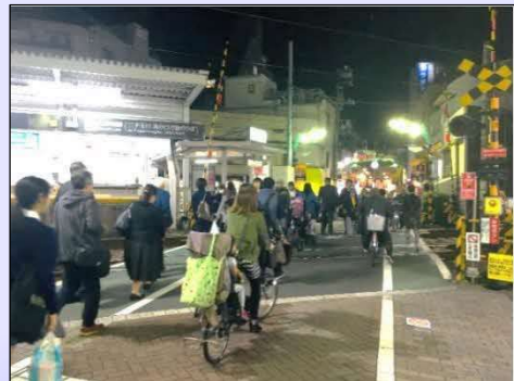
▲戸越公園駅付近における踏切の様子

平成28年より東京都が戸越公園駅付近における連続立体交差事業について調査検討を進めてきた結果を踏まえ、国に着工準備に係る補助金を要望しておりましたが、4月に採択されました。