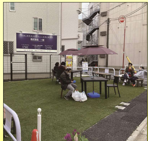
▲商店街に面する道路予定地

ここは将来、道路（補助第29号線）として整備される場所ですが、暫定的に人工芝を整備し、地域のみなさまの憩いの場、商店街の賑わいの場として利用いただけるようベンチなどが設置されました。