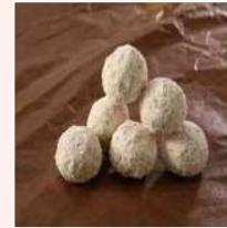
ルシアンクッキー (ごまきなこ)