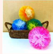
ナイロンたわし (アメリカンたわし)

西大井1-8-7 TEL : 6429-8401 FAX : 3776-1601