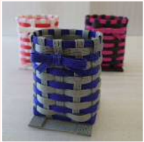
ペーパークラフト

北品川3-7-21 4F TEL : 3458-4307 FAX : 3458-4305