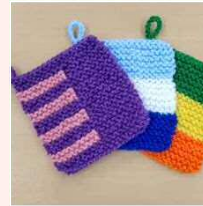
アクリル毛糸たわし (びっクリーナー)

西五反田2-24-2 TEL : 5435-1808 FAX : 5435-0563