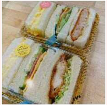
BOXサンド (えびカツ・チキンカツ・トマト・ハム等)