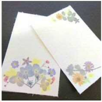
手作り押し花ハガキ