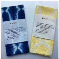
草木染めてぬぐい（しぼり）

レインコートの生地で作っており、軽くて丈夫でかさばらず、携帯するのにとても便利です。色やサイズも複数あります。