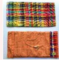
さをり織りブックカバー