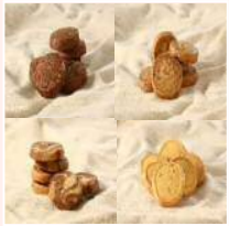
ミックスクッキー (オレンジ・マーブル・アーモンド・ごま)

北品川3-7-21 4F TEL : 3458-4307 FAX : 3458-4305