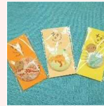
くるみボタン (バッジ)