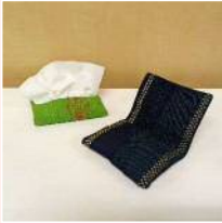
ティッシュケース

西大井1-8-7 TEL : 6429-8401 FAX : 3776-1601