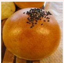
小倉あんパン他 菓子パン