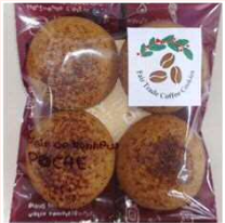
クッキー (コーヒー)