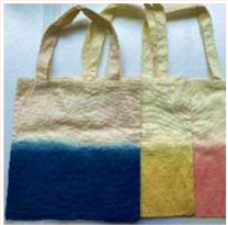
草木染めトートバッグ