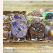
焼き菓子詰め合わせ ※要相談