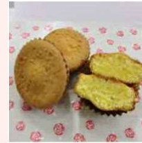
マドレーヌ (プレーン・抹茶)