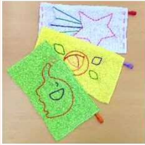
刺繍入りぞうきん (陽気なぞうきん)

西五反田2-24-2 TEL : 5435-1808 FAX : 5435-0563