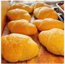
塩バターパン他 お総菜パン

二葉1-6-1廣浦ビル1F TEL：6421-6633 FAX：6421-6603