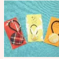
くるみボタン (ヘアゴム・ヘアピン)