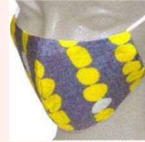
立体マスク (キッズ・M・L)

西品川1-28-3 TEL : 3787-5750 FAX : 3787-5760