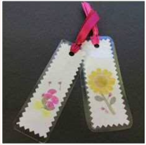
手作り押し花しおり