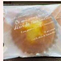
マドレーヌ (プレーン・紅茶・チーズ・チョコ)