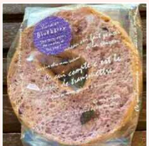
ベーグルラスク (ブルーベリー・チョコ・黒糖)