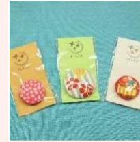
くるみボタン (マグネット)