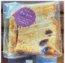
ラスク (シュガー・ガーリック・レーズン)