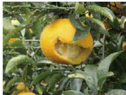
食べられた夏みかん