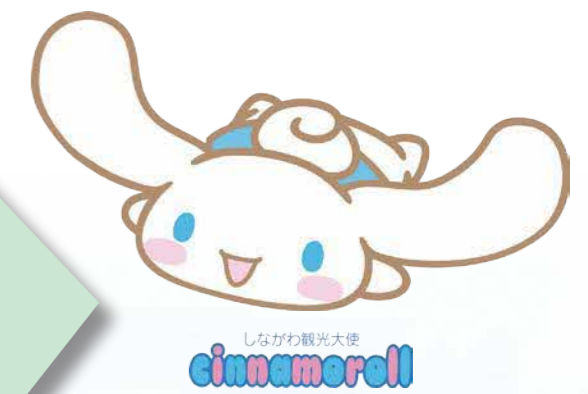
しながわ観光大使 cinnameroll

このように「しながわ学びの杜」では、意欲のある方なら必ずご納得いただける講座を、多数ご用意しています。ご自身に合った学びを選び、たくさんの仲間と一緒に有意義な時間を過ごされ、ご自身の「生きがい」としていただくとともに、その成果を地域の活力や賑わいにつなげていただくことを心から願っています。