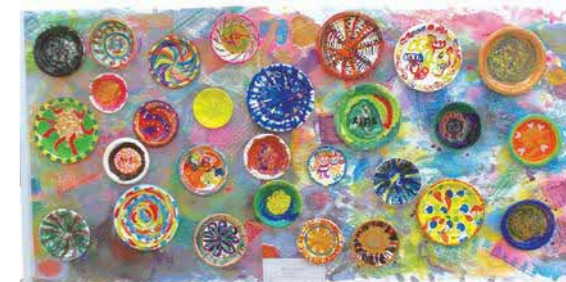
品川区「障害者作品展」出展作品

日程：6月～12月 時間：午後 定員：10名 会場：中小企業センター(西品川1-28-3)など 回数：12回 受講料：2,400円 その他：プログラムによっては、他に実費負担の場合あり