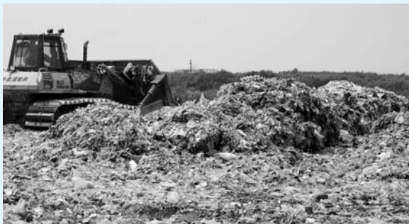
中央防波堤外側埋立処分場

埋め立て処分場の延命と資源の有効活用のため、20年度を目途に導入するサーマルリサイクルに向けての分別変更を予定しています。