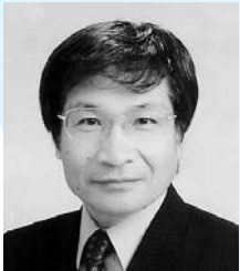
尾木直樹 (教育評論家)