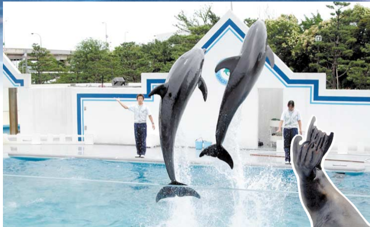
ダイナミックなショータイム

幼魚の間の横じま柄が有名。岩場を好み、くちばしのような頑丈な歯で貝類などをかじりとって食べます。