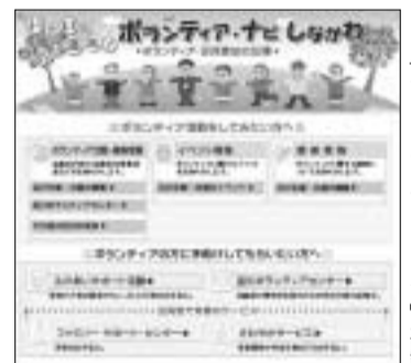
「ボランティアナビ しながわ」の画面