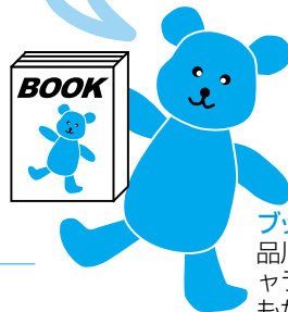
ブックマくん 品川区子ども読書活動推進のPRキャラクター「ブックマくん」は子どもから募集し、つけられた名前です。

ぼくは本が大好き。とくいなことはみんなにおもしろい本を教えてあげることなんだ。みんなもぼくと一緒に楽しく本を読もうよ!