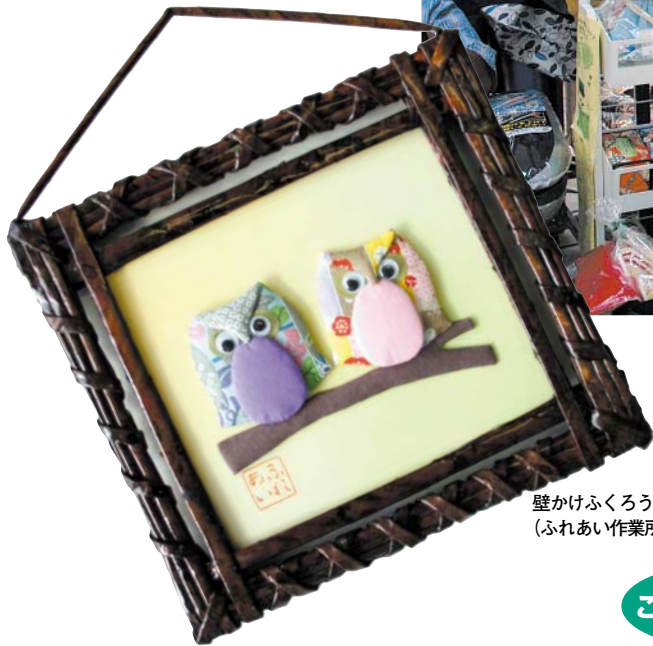
壁かけふくろう (ふれあい作業所)