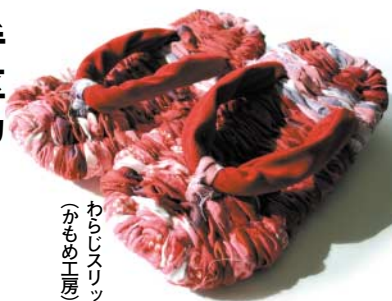
わらしスリッパ (かもめ工房)