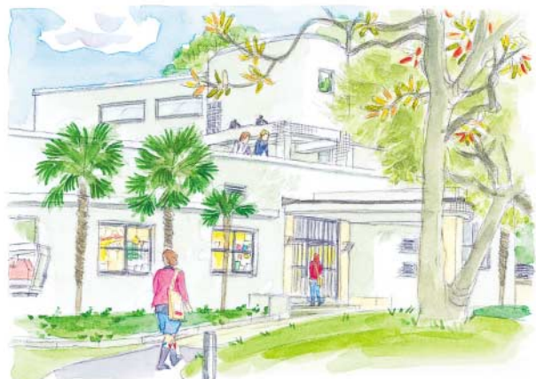
庭園も楽しい原美術館

美術館のそばにはミャンマー大使館やセルビア・モンテネグロ大使館のほかに翡翠原石館もあります。深いグリーンにひすいを見つめていると、太古の時間にタイムスリップしたような気分になるから不思議です。御殿山には『宮本武蔵』など時代小説で著名な作家・吉川英治が住んでいたこともあるそうです。