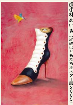
小林めいぎ(地球はともだちポスター展2005)