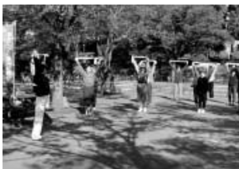
仲間と一緒に公園で運動

ウォーキングやジョギング、水泳などの有酸素運動はエネルギーを消費します。筋力トレーニングやストレッチなど日々の生活の中でできる運動を見つけ、習慣づけましょう。