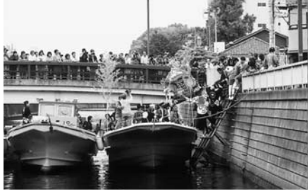
洲崎橋のたもとから神輿を船に乗せる