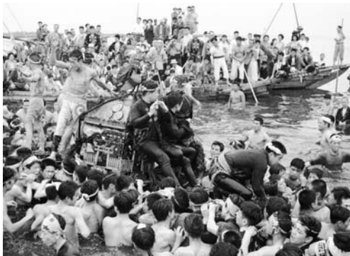
昭和34年の海中渡御の様子