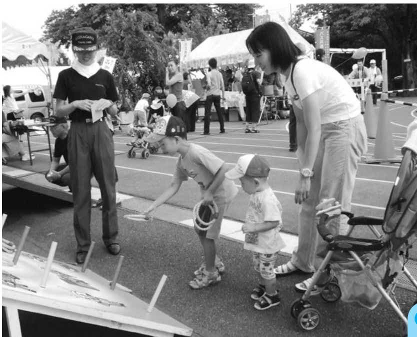
輪投げに挑戦 (品川消防署職員手づくりの輪投げ)