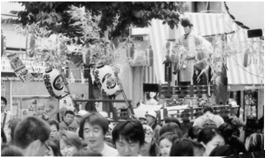
おごそかな山車の巡行