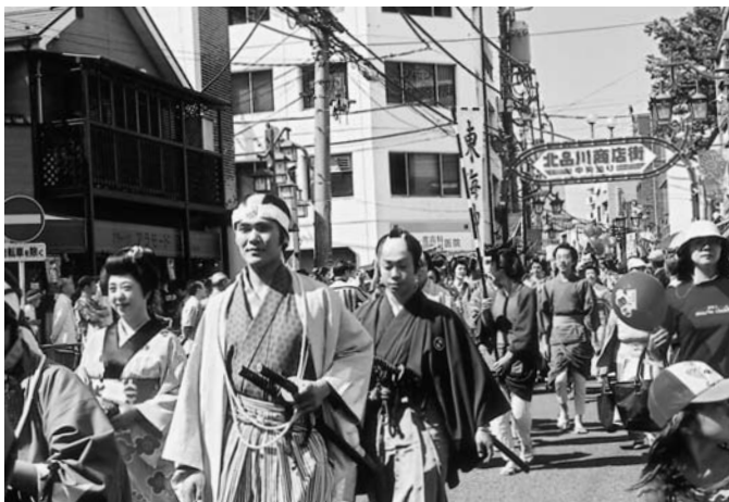
江戸風俗行列のパレード