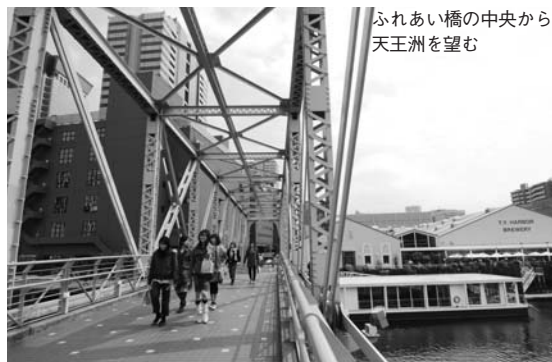
ふれあい橋の中央から天王洲を望む