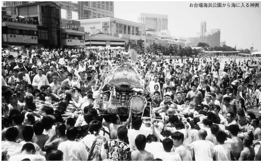
お台場海浜公園から海に入る神輿