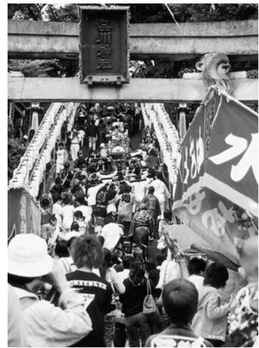
品川神社の階段を上る神輿

品川神社の祭礼では、神輿が品川拍子にあわせて各町内を巡行します。祭りの最大の見所は、本社神輿の宮出しと宮入り。神輿を担いで品川神社の急な階段を下り、町内巡行をすませてから夕方また階段を上ります。今年特別に、秋篠宮ご夫妻の長男悠仁様誕生をお祝いし、10日(日)の夕方、八ツ山から品川神社まで、本社の480貫(約1,800kg)の大神輿と380貫(約1,425kg)の中神輿の連合渡御が予定されています。