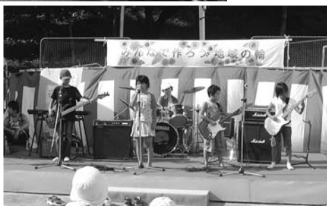
子どもたちのバンド 演奏。日ごろは東品 川児童センターで練 習している