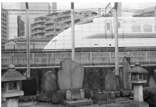
日本最初の鉄道建設で指揮をとった井上勝のお墓は東海道線を望む場所にあり、墓の後ろを新幹線が通る

沢庵和尚開山の名刹「東海寺」の墓地で、現在の場所は東海寺の旧境内にあたります。沢庵和尚のほか、賀茂真淵、服部南郭、井上勝などのお墓があります。