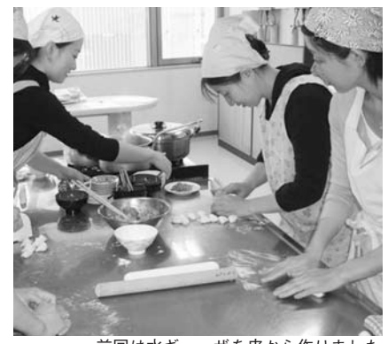
前回は水ギョーザを皮から作りました

■20代から30代のための料理教室 さっぱりと初夏の献立 いつもの食材でレパートリーをUP! 日6月2日(土)午後2時～4時30分 会きゅりあん(大井町駅前) 内あじの塩焼きピリ辛ねぎソース、大豆とクレソンの香りごはん、レタスの中華おひたし、かぼちゃのミルク煮、デザート 20～30歳代の方25人(先着) ¥1,000円 持ち物/エプロン、三角きん、ふきん2枚(食器用、台ふきん) 主催/品川栄養士会 日5月30日(木)までに、電話で健康課健康づくり係☎5742-6746へ