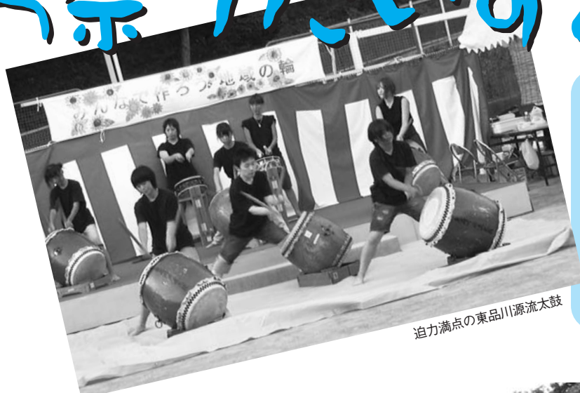
迫力満点の東品川源流太鼓

品川区の北東に位置する品川第一地区。旧東海道に残る昔ながらのまちなみ、大使館や原美術館、お屋敷が並び山の手の雰囲気はただよう御殿山、水辺の空間を楽しめる天王洲など、様々なまちの表情をもっています。また品川を代表するお祭りが行われる地域でもあり、「お祭りが生活の中心」といった人もいるお祭り好きの土地柄です。そんな“しないち”の祭り自慢をご紹介します。