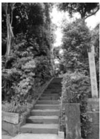
大山墓地入り口周辺

沢庵和尚開山の名刹「東海寺」の墓地で、現在の場所は東海寺の旧境内にあたります。沢庵和尚のほか、賀茂真淵、服部南郭、井上勝などのお墓があります。