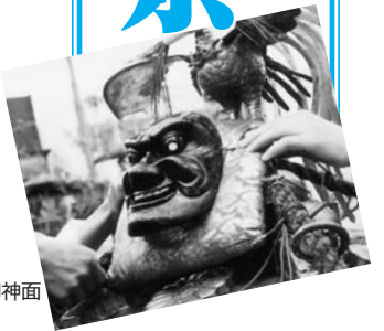
神輿の屋根につけられた御神面

荏原神社の祭礼は江戸時代から続くお祭りです。豊漁と豊作を祈願して行われてきました。最大の見所は祭り最終日、「かっぱ祭り」とも呼ばれる神輿の海中渡御です。神輿は洲崎橋のたもとから船で目黒川を下りお台場まで運ばれ、海から拾い上げたと伝えられる素戔鳴尊(須佐之男命)の御神面を屋根につけて海中に入ります。水しぶきをあげながら神輿を荒々しく担ぐ姿は勇壮で、見守る人たちからは歓声があがります。