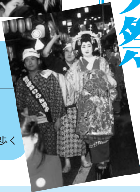
華やかな花魁道中

●6月9日 「おいらん道中」 午後7時ごろから 地元の人たちが花魁にふんしてまちを練り歩く