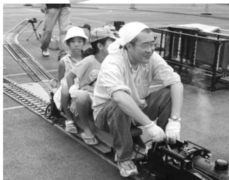
小さくても力持ち！ “ミニSL”列車の運 行もボランティアの 方たちによるもの

品川区の北東に位置する品川第一地区。旧東海道に残る昔ながらのまちなみ、大使館や原美術館、お屋敷が並び山の手の雰囲気はただよう御殿山、水辺の空間を楽しめる天王洲など、様々なまちの表情をもっています。また品川を代表するお祭りが行われる地域でもあり、「お祭りが生活の中心」といった人もいるお祭り好きの土地柄です。そんな“しないち”の祭り自慢をご紹介します。