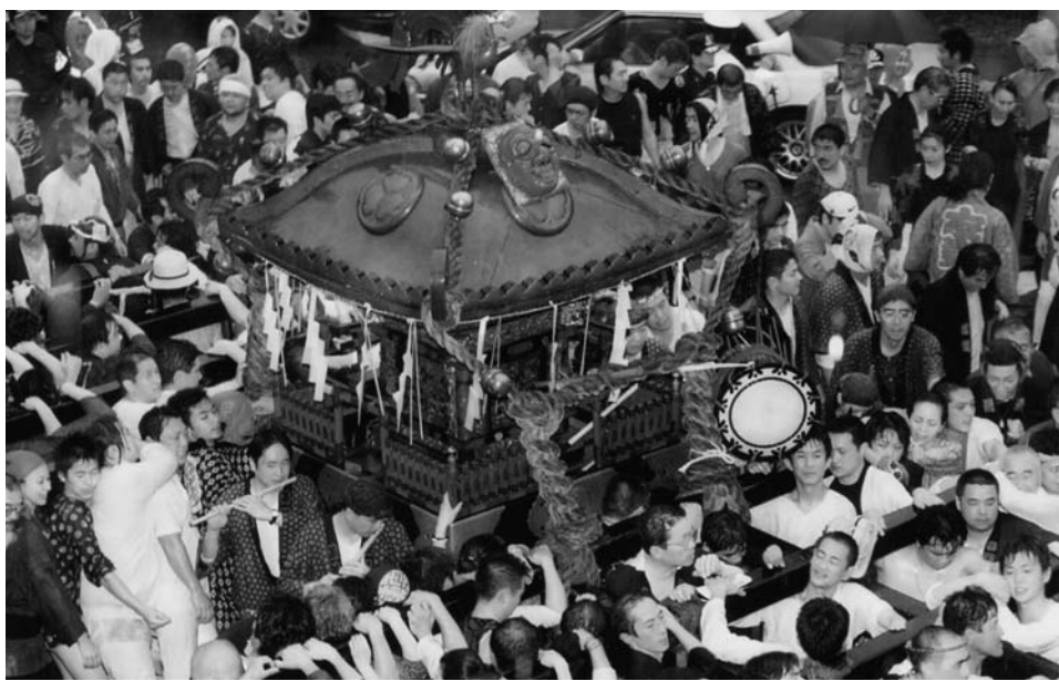
品川拍子にあわせて巡行する本社大神輿

品川神社の祭礼では、神輿が品川拍子にあわせて各町内を巡行します。祭りの最大の見所は、本社神輿の宮出しと宮入り。神輿を担いで品川神社の急な階段を下り、町内巡行をすませてから夕方また階段を上ります。今年特別に、秋篠宮ご夫妻の長男悠仁様誕生をお祝いし、10日(日)の夕方、八ツ山から品川神社まで、本社の480貫(約1,800kg)の大神輿と380貫(約1,425kg)の中神輿の連合渡御が予定されています。