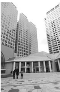
シーフォートスクエア

天王洲の地名は、荏原神社天王祭の神輿に飾られる「牛頭天王」の面が流れ着いたことに由来します。1980年代後半から再開発事業が始まりホテル、オフィスビル、レストランなどが次々と完成。ボードウォークやふれあい橋なども整備され、水辺の人気スポットに。テレビのロケ地にもよく利用されています。