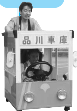
安全運転で発車オー ライ！北品川にある 都バス営業所の職員 の手づくりバス