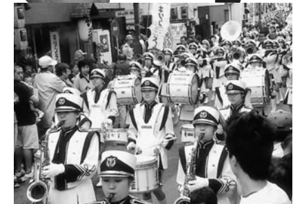
第1回から参加協力してくれている品川女子学院のブラスバンド