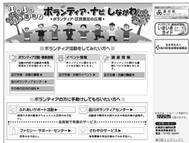
「ボランティア・ナビしながわ」トップページ