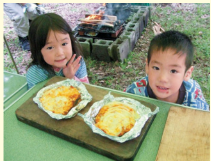
鉄板を重ねたオープンで焼いた手作りピザ

日 8月24日(金)午前8時~26日(日)午後6時 (2泊3日、区役所集合・解散、往復バス) 会 軽井沢レクの森キャンプ場 人 40人 (抽選) 料 12,000円 (小・中学生8,000円、3歳以上4,000円) 主催/品川区キャンプ協会 日 7月10日(火)までに、はがきかFAXに 「キャンプ」とし、住所、電話番号、参 加者全員の氏名・年齢をスポーツ協会へ