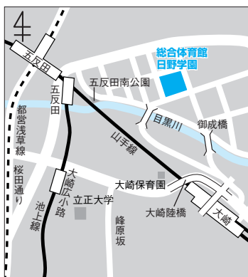
総合体育館 日野学園(東五反田2-11-1)