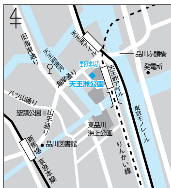
天王洲公園野球場(東品川2-6)