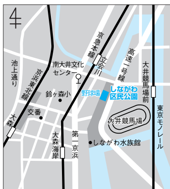
しながわ区民公園(勝島3-2)