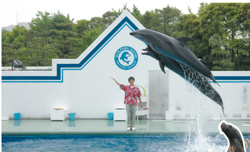
ダイナミックなショータイム