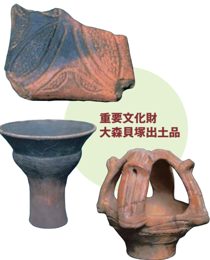
重要文化財 大森貝塚出土品