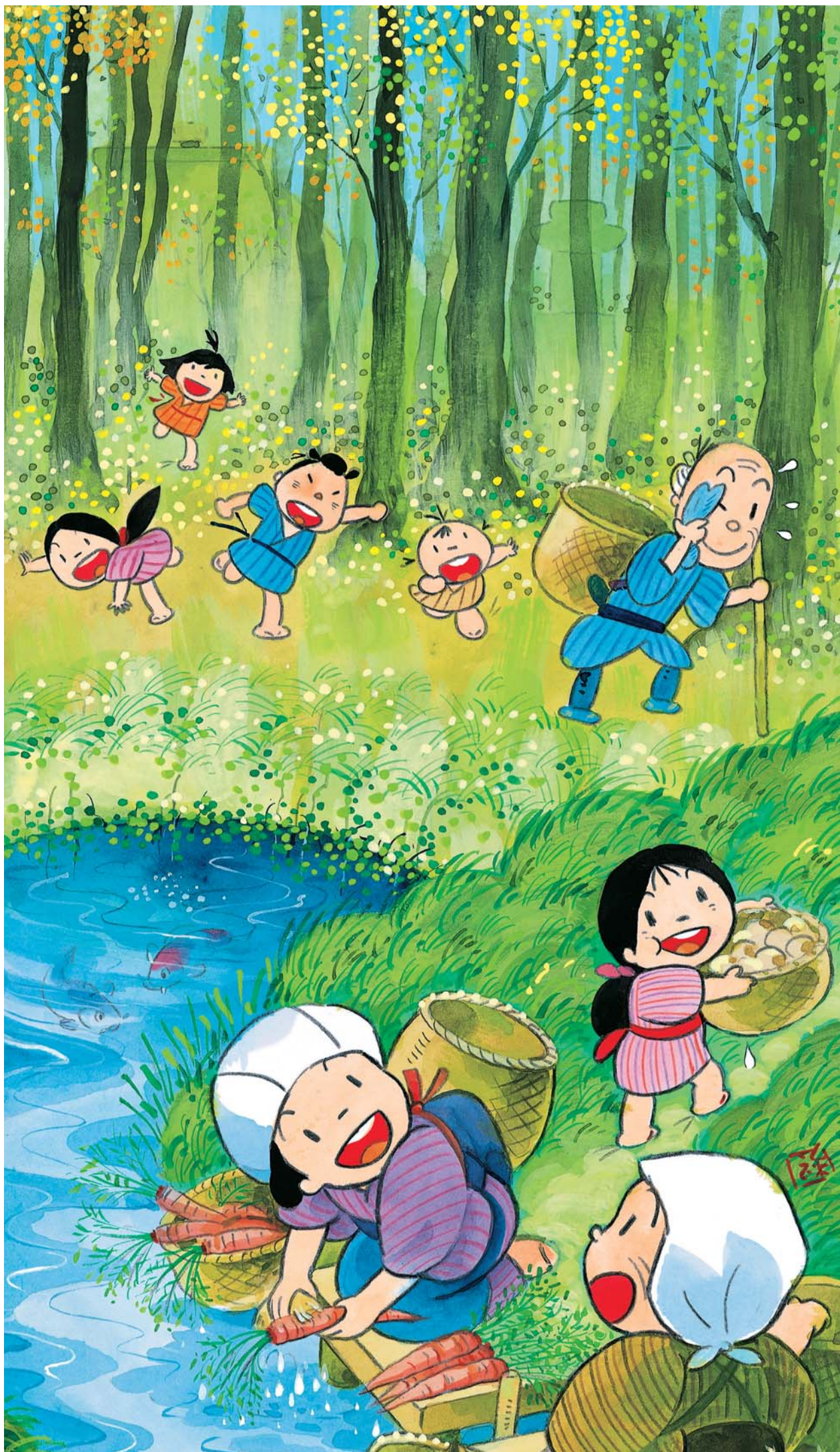
今でもこの水神池には、コイがたくさん泳いでいます。関東大震災以後は非常用の貯水池として人々の生活に利用されていました。