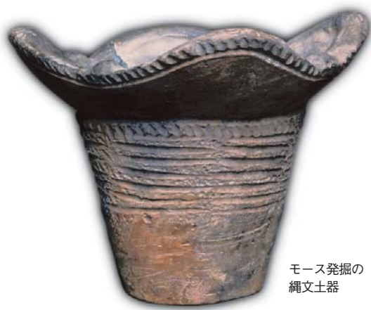
モース発掘の 縄文土器

日本考古学発祥の地・大森貝塚発掘130周年を記念して、モース博士が大井の地で発掘した大森貝塚の魅力とその後の展開を紹介し、あわせて近年発掘された東京周辺の貝塚について紹介します。