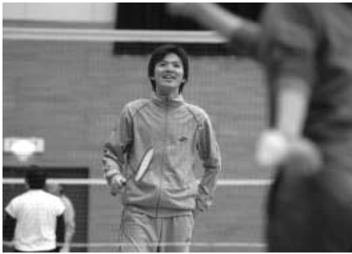
総合体育館フリー教室