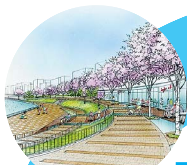
東五反田二丁目親水広場

「勝島運河の土手に花畑をつくろう」と商店会が中心となって行っている活動です。美しい景観を作り出すだけでなく、参加者の交流の場にもなっています。地域ぐるみの景観づくりがほかの地域にも広がれば、美しい景観がそれぞれの地域ごとに生み出されていきます。