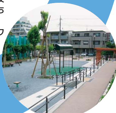
西霧ヶ谷公園(防災広場)