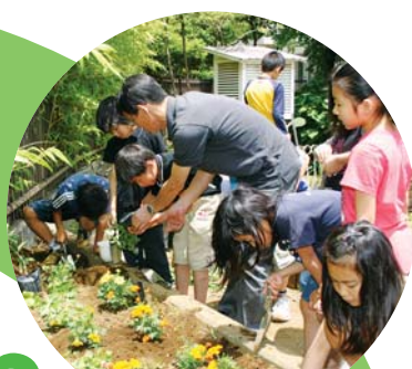
八潮小学校での活動