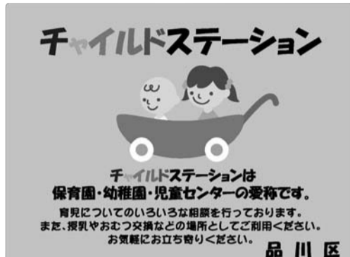
チャイルドステーションの入り口にはこの看板があります

子育てに関する相談が気軽にでき、仲間同士での交流や情報交換ができます。妊娠期から地域の身近な施設として、授乳やおむつ交換の場所としても気軽にお立ち寄りください。