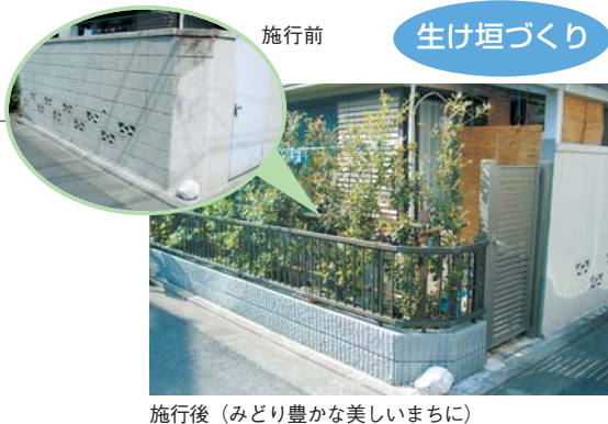
施行後（みどり豊かな美しいまちに）

皆さんの身近にみどりを増やし育てていくことは、地域の環境とまちなみの景観を向上することにつながります。区では、屋上等緑化助成制度や生垣助成制度を設け、屋上庭園や生け垣などを新たに作る場合に、費用の一部を助成しています。また、地域の緑化を推進する町会・自治会を支援するために「みどりのモデル地区事業」なども実施しています。ぜひこうした制度をご活用ください。