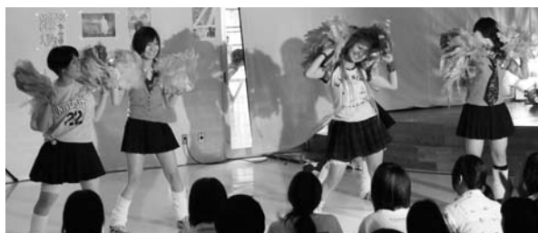
KIDS NOW パーティー IN やしお