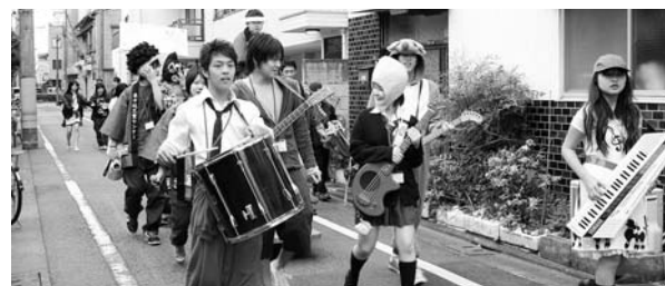
KIDS NOW パーティー IN とうなが