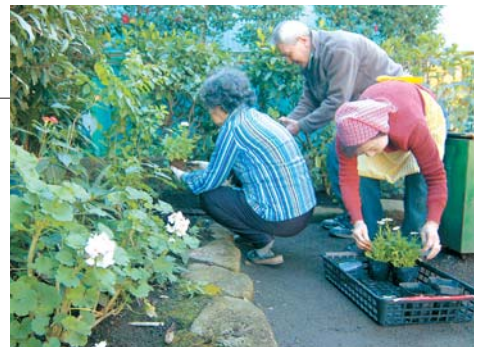
みどりと花のボランティア(南品川6丁目特定児童遊園)

活動に必要な道具は区で用意します。また、花壇で花苗を植えてくださる団体には、花苗などを購入する費用の助成制度もあります。