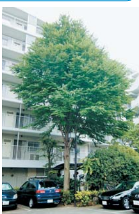
保存樹のカツラ（二葉1丁目）

都市や市街地からはみどりが失われつつあり、品川区も例外ではありません。そこで、大木や広い面積の樹林のうち、容姿・健康に優れたものを所有者の同意の上で保存樹、保存樹林として指定しています。指定した場合には標識を設置します。また、維持管理の一部を区が手伝います。