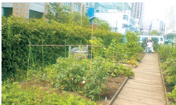
マイガーデン東五反田

区内の遊休地や公共空間を利用して、土に触れ、野菜などの収穫を楽しみながら緑化を進める区民農園（マイガーデン）の貸し出しを行っています。 ・マイガーデン東五反田（東五反田1-18） 12区画（1区画10m 2 ） ・マイガーデン南大井（南大井1-13） 57区画（1区画10m 2 ） ●毎年2月に本紙などで利用者を募集します。