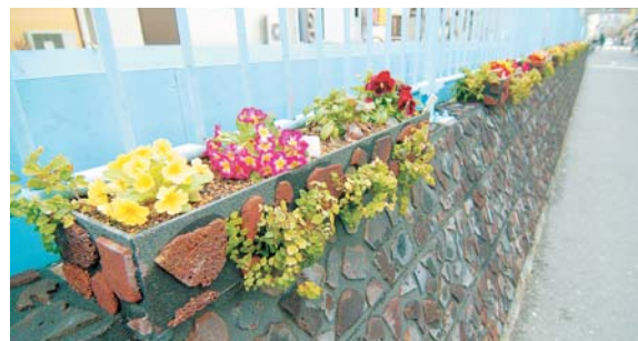
立会川護岸緑化（4・5年かけてツタをのぼし護岸を覆います）

目黒川や立会川の護岸をツタ類で覆い、都市のヒートアイランド化を緩和していきます。また、区民の方の協力により花植えも行っています。