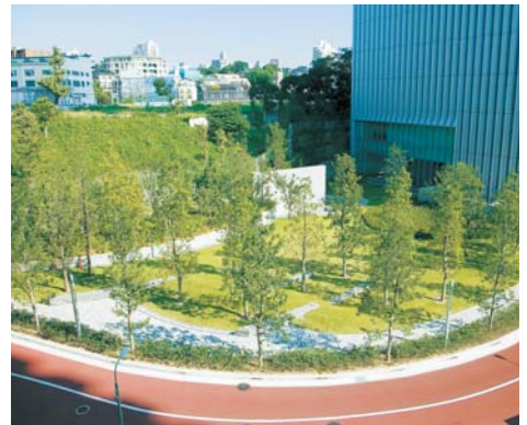
DNP五反田ビル