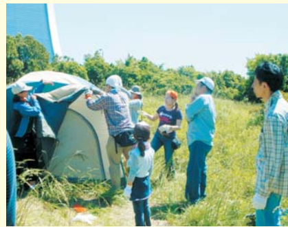
みんなで力を合わせてテント張り

回 ①5月25日(日) ②6月8日(日) 午前9時～午後3時(雨天中止) 会 大井ふ頭野外活動広場(八潮2-1) 人 各40人(抽選) 料 各1,200円、3歳～小学生各700円(昼食付き) 主催/品川区キャンプ協会 回 5月11日(日)までに、はがきかFAXに「デイキャンプ体験」とし、希望日、参加者全員の氏名・年齢、代表者の住所・電話番号をスポーツ協会へ