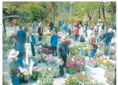
花と植木の即売市(春と秋の年2回開催)