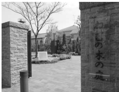
旧正田邸の門を再現