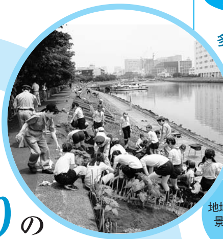
地域ぐるみの景観づくり

地域にふさわしい水辺やみどりは、地域が誇れる景観づくりや快適な生活空間づくりにつながります。