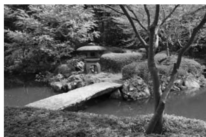
橋を渡って池の周囲を巡る