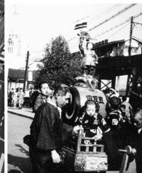
当時のお祭り風景、大崎橋付近。右上に見えるのは東急線(昭和10年ころ)

五反田駅周辺の移り変わりを写真で見よう 変わりゆく五反田 JR、東急、都営線の三つの路線が乗り入れている五反田駅。駅、そして駅周辺は現在改良工事が進み、今年3月には駅西側に複合商業施設が開業しました。JR五反田駅の開業は明治44年10月15日。当初は東側にしか改札口はなかったそうです。続いて昭和3年には東急池上線が、昭和43年には都営地下鉄1号線が開通しました。