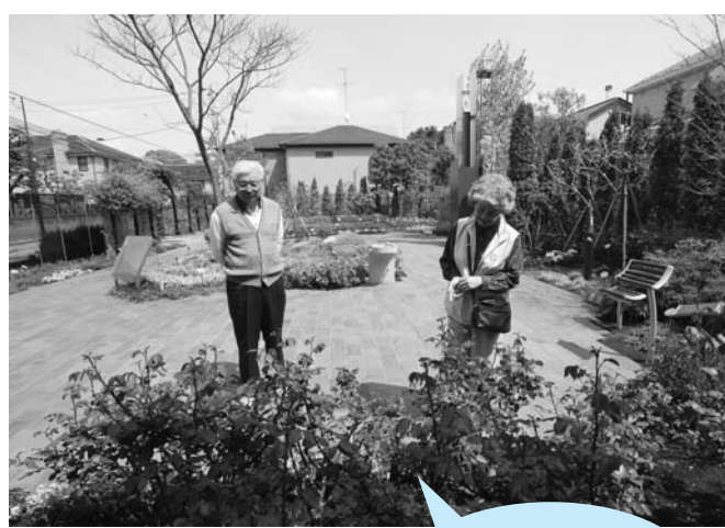
整備の行き届いた庭園

●所在地/東五反田5-19 ●最寄り駅/「五反田」 ●開園時間/午前9時~午後5時