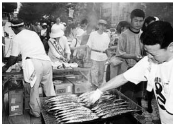
岩手県宮古港から直送されたサンマを備長炭で焼き、徳島県神山町産のスタチ、栃木県高林産の大根おろしで食べる