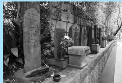
安楽寺の供養塔群