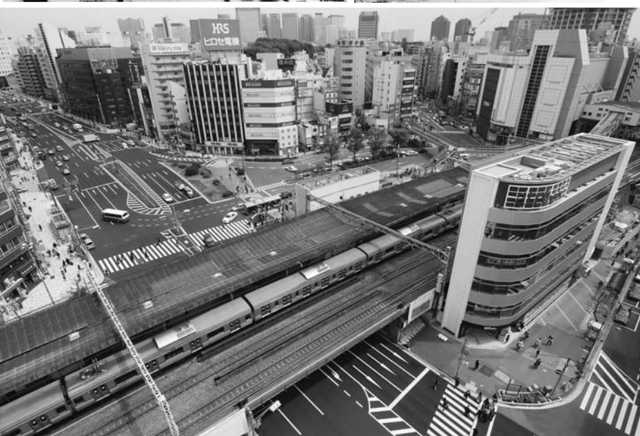
3月に複合商業施設(手前)がオープンした五反田駅前。遠くには島津山の緑が見える

五反田駅周辺の移り変わりを写真で見よう 変わりゆく五反田 JR、東急、都営線の三つの路線が乗り入れている五反田駅。駅、そして駅周辺は現在改良工事が進み、今年3月には駅西側に複合商業施設が開業しました。JR五反田駅の開業は明治44年10月15日。当初は東側にしか改札口はなかったそうです。続いて昭和3年には東急池上線が、昭和43年には都営地下鉄1号線が開通しました。