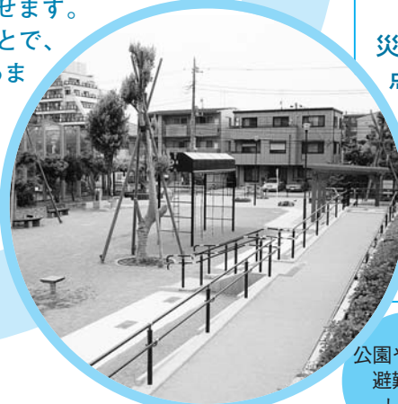
公園や緑地は避難所としても

水辺やみどりをネットワーク化することは、避難場所と避難路を結んで区全体の安全性を高めることにつながります。