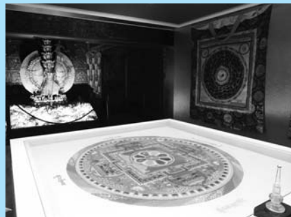
安養院に保存されている砂曼陀羅

一方、服飾の世界で日本の洋装化に大きな影響を及ぼした杉野芳子。その杉野が設立した杉野学園衣裳博物館⑦(上大崎4-6-19)は西口を出てドレメ通り沿いに。氏自らがヨーロッパで収集したドレスの展示ほか、企画展が催されています。