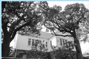
インドネシア大使館 (官邸)

インドネシア大使館、コロンビア大使館、ザンビア大使館、タイ大使館、パラグアイ大使館、マリ大使館など、大崎第一地区には多くの大使館が点在します。