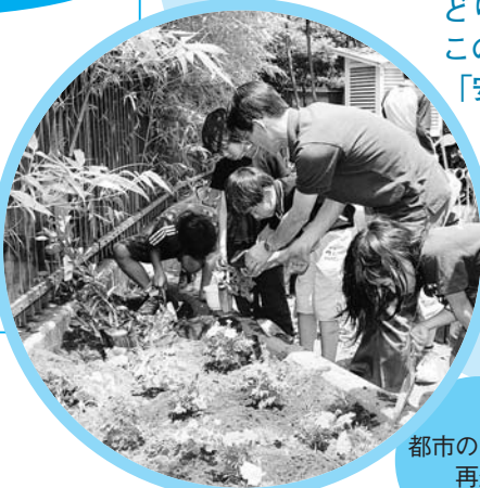
都市の自然を再生

水辺やみどりは、生活環境を改善するとともに、鳥や昆虫の生息環境の拡大にもつながります。