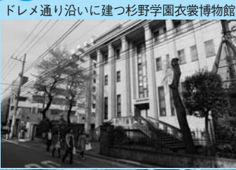
ドレメ通り沿いに建つ杉野学園衣裳博物館

もう一つは多数の仏像、曼荼羅絵などチベット仏教に関する貴重な資料が展示され、圧倒的な存在感を放つ安養院美術館⑧(西五反田4-12-1)。通常数日間です壊してしまうという珍しい砂曼荼羅も見ることができます。