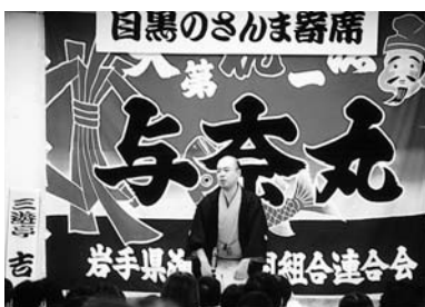
目黒のさんま寄席

場所/誕生八幡神社(上大崎2-13-36)周辺 最寄り駅/「目黒」 今年の祭り/9月7日(日)