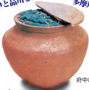
府中市出土常滑大甕