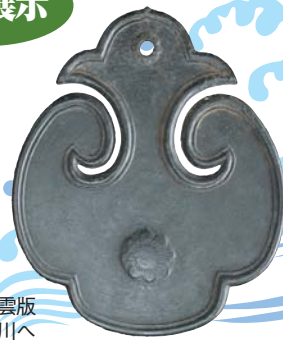
海晏寺銅製雲版 上総から品川へ