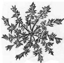
地面に平らに広がった“たんぽぽ”を見て、模様を見てくれとうったえかけているように思えた。

空き地の原っぱでは、夏草の“猫じゃらし”の穂が一面に白くなっていて、その場にしゃがみ込んで地面すれすれから眺めてみると、まるでススキが原のようだった。見上げた秋空には消えなかった飛行機雲の筋が2本。近場の自然観察に目覚めたこの感慨と習慣を、冬のころにもまた持ち込んでみたい。