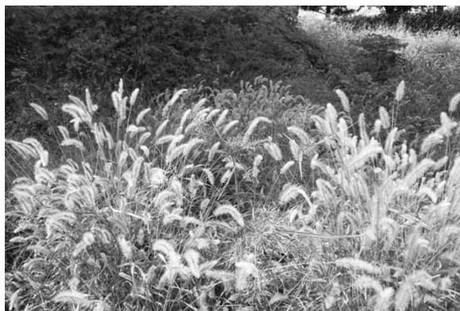
“猫じゃらし”の群生が、まるでススキが原のように見えた。