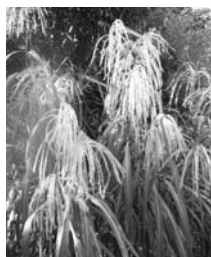
西大井広場公園のススキ

御殿山から目黒川遊歩道、ゲートシティ大崎へ。入り口では、美しいコスモスの花が満開だった。早速スケッチをする。さらに西大井方面にまで足を伸ばす。西大井広場公園の遊歩道で尾花 おぼな （ススキ）が桜木の根元に美しく咲くのを見て、胸が高鳴った。秋を告げて誇らしげであった。