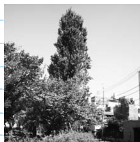
公園のシンボルツリーにもなっているポプラです。

東海道線沿いにある細長い公園、大井水神公園へ行ってみました。早咲きの河津桜と30本ほどの桜の並木に囲まれ、春はお花見に最適です。公園の真ん中には、シンボルツリーとしてポプラ、ネズミモチ、白木蓮 はくもくれん が植えられて、木陰のベンチは快適なオアシスです。子どもたちが遊べる遊具は2カ所あり、親子連れの楽しそうな姿が見られます。ふれあい作業所の若い方々の毎日の清掃、シルバー人材センターの方々の協力できれいになっていますが、家庭ごみの持ち込みが多いとお話には心が痛みました。