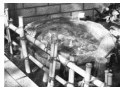
大森貝塚遺跡庭園から桐畑隧道を抜けた左わきに湧き水が...