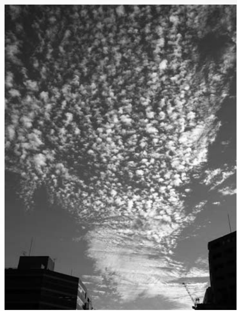
五反田駅近くの空。空いっぱいに広がるうろこ雲を見つけ、ちょっと感動しました。私たちの頭の上には、もっと大きな自然があるのですね。

広報ボランティアの方たちが近所を歩いて、小さな自然を見つけ、観察し、記録しました。これは特別ではない、あなたのそばにもある自然です。