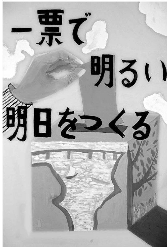
平成20年度明るい選挙啓発ポスターコンクール 品川区選挙管理委員会委員長賞 古田卓也さん(八潮学園8年)