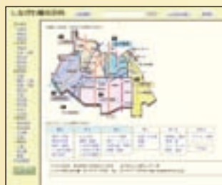
しながわ観光百科の画面

しながわ観光協会では、15年度から「しながわの観光情報」をホームページで全国に発信する「観光資源台帳」作成に取り組みました。21年4月からホームページしながわ版に「しながわ観光百科」として掲載し、現在740件余りの観光情報をご覧いただけます。