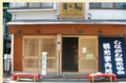
しながわ観光協会観光案内所

開設日時 / 土・日曜、祝日午前10時～午後4時 所在地 / 北品川1-2-6 (品川宿あぶりや連)