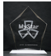
マイスター店認定証(エンブレム)

皆さんに選ばれた「おすすめのお店」です。ぜひ足を運び、お店の魅力にふれてみてください。