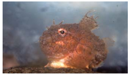
ナメダング(しながわ水族館)

氷の妖精クリオネと冷たい海にいたわい魚ナメダングの同時展示が実現しました。 日5月10日(月)まで 入館料/1,300円(800円) 小・中学生600円(400円) 4歳以上300円(200円) ※区内在住の方は、住所が確認できるものを各自窓口で提示すると、( )内の料金で入館できます。 日しながわ水族館(勝島3-2-1しながわ区民公園内 ☎3762-3433)