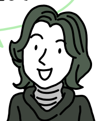
西大井在住 1歳児・3歳児のお母さん

2人目を出産し、 改めて子育て支援特集号を 読んでみたら、上の子のときと 制度が変わったり新しく 始まつたりしていたのがわかって、 助かりました。