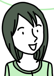
西大井在住 1歳児のお母さん

品川区に 転入してきたばかりのときに 読んだので、「品川区の子育て」 を全体的に知ることができて よかったです。