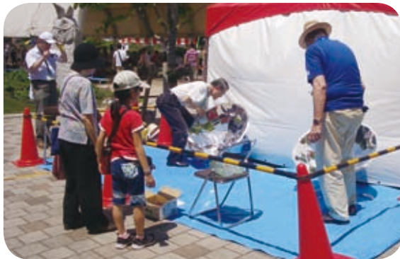
ソーラークッキング風景