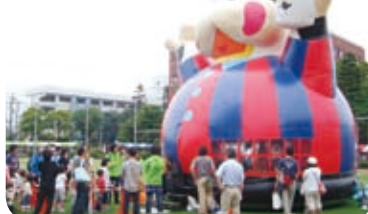
ふわふわ空気ドーム

バンド演奏、ダンス、ふわふわ空気ドーム、ボールプール、体験型エコアート、サッカー体験など