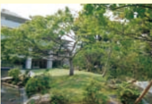
アリュールゼームス坂