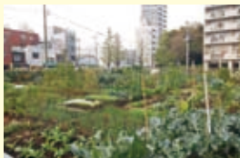
マイガーデン南大井