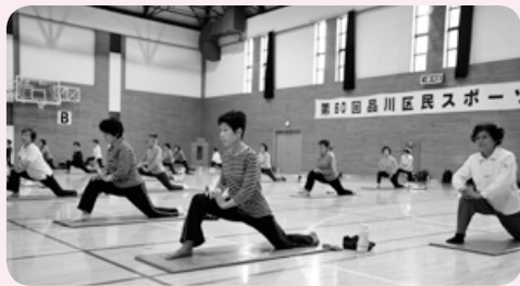
【レディースフィットネス】 日時／水曜日午前10時～11時30分