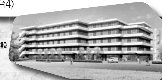
東大井4丁目に建設予定の高齢者住宅（イメージ図）

施設ではなく、できるだけ地域で暮らせるように、入浴や食事などのサービスと見守り機能をより高めた住宅を整備しています。（東大井4、旗の台4）