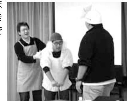
ケアマネジャーが寸劇を活用し認知症の方への対応を実演