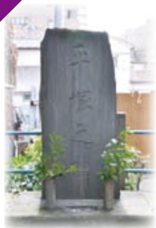
「平塚の碑」 中延にある新羅三郎伝説を伝える碑