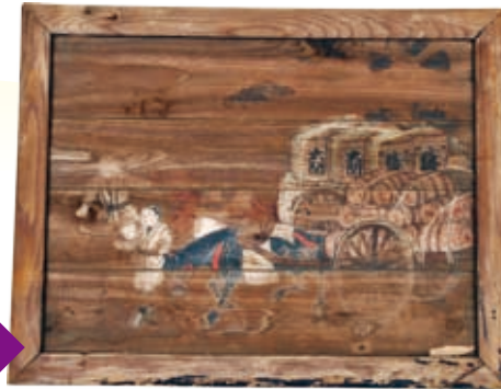
「旗岡八幡神社絵馬」 米と酒を運ぶ荷車

交通案内 ・大井町駅西口から東急バス池上行・蒲田行で「鹿島神社前」下車徒歩1分 ・大森駅北口から池上通り徒歩10分 ・京浜急行立会川駅から徒歩13分