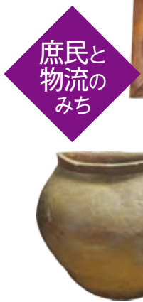
庶民と物流のみち