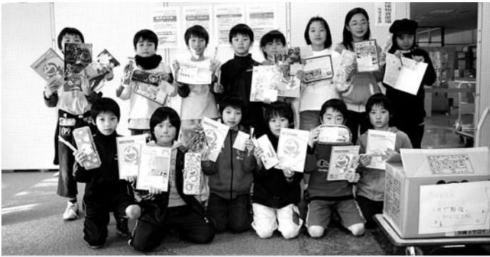
三木小学校の6年生が中心となり、全校で募金活動を行い、日本赤十字社に約8万円寄付しました。また、4年生54人は文房具などを持ち寄り、「頑張ろうカード」と名付けたメッセージカードとともに届けました。

3月25日(金)、三木小学校と荏原第六中学校の子どもたちが、被災した人たちのために何が出来るかを自ら考え、行動して集めた義援金や支援物資を区役所に届けました。