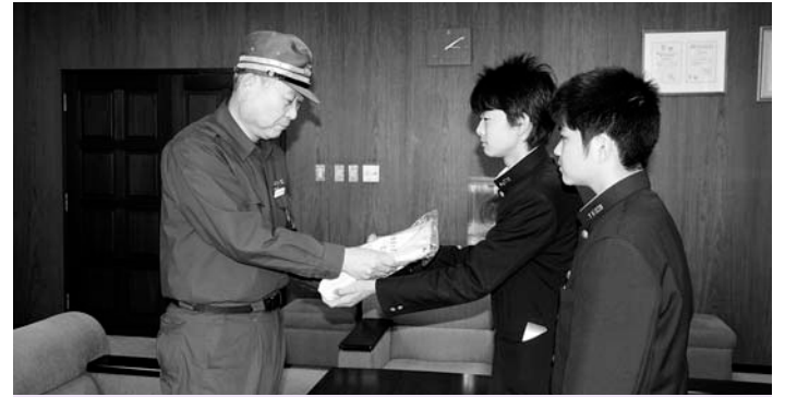
荏原第六中学校では、生徒会が企画し、3月23日(水)・24日(木)の2日間、西小山駅前や学校の正門前で募金活動を行い、約44万円の義援金が集まりました。

またこの他にも、荏原第五中学校、戸越小学校、小山小学校などでも、集めた義援金を受付窓口となっている高齢者福祉課へ届けました。