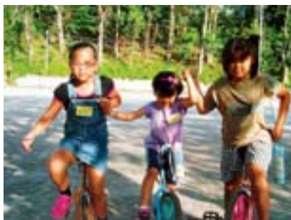
審査員賞 ともだち