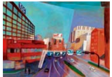
TOC とゆうほうとのある街並み 西五反田 7、8