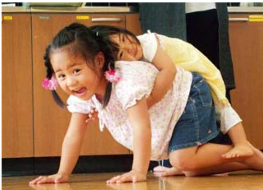
区長賞 子どもの絆