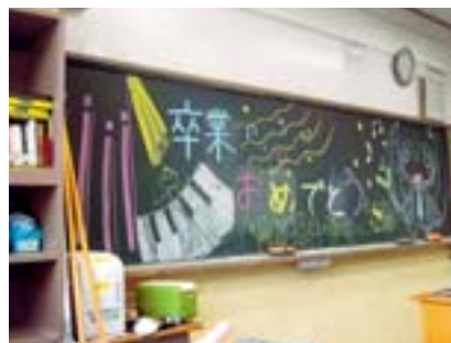
子ども審査員賞 最後の絆