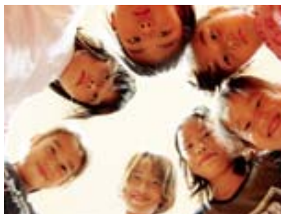
子ども審査員賞 円陣