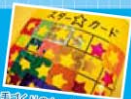
手づくりのカード

指導員手づくりのプリントを使って、学校の授業に合わせながら、国語と算数の補習を行っています。プリントができれば、シールをカードにはります。