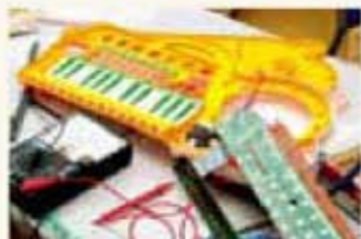
電気系統の故障を修理、使用する工具は手づくり