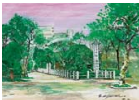
鈴ヶ森刑場跡と大経寺 南大井 2-5-6