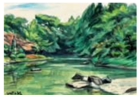
戸越公園 豊町 2-1