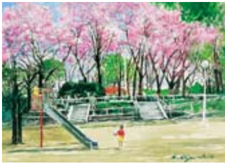
権現山公園 北品川 3-9