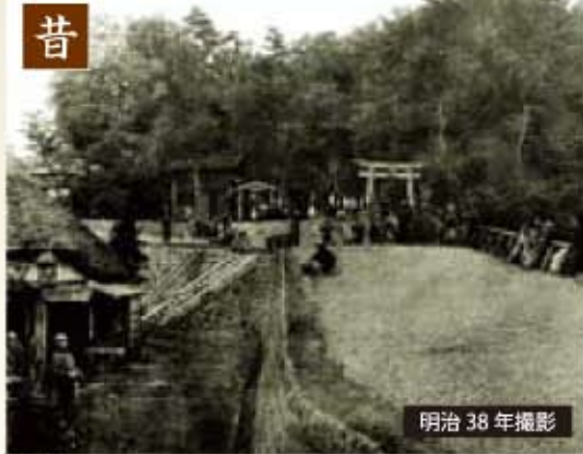
明治 38 年撮影