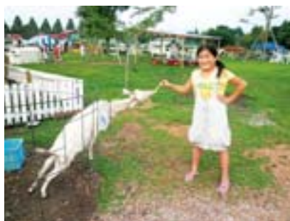
審査員賞 くいしんぼうのやぎ