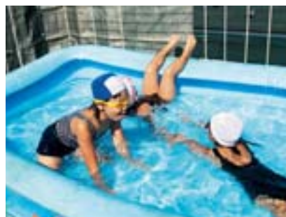
審査員賞 お友達の家のおく上