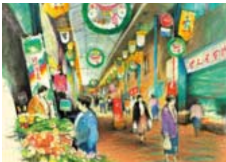
中延商店街のにぎわい 東中延 2、中延 3