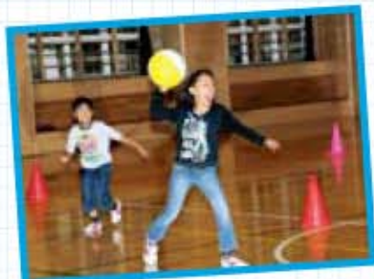
体育館でボール遊び