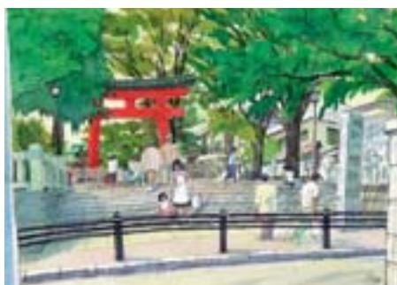
旗岡八幡神社 旗の台 3-6-12