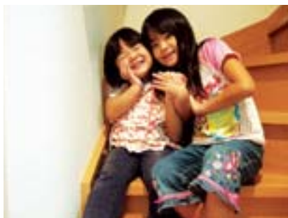
子ども審査員賞 かぞく