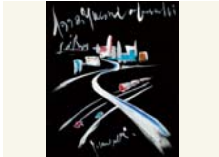
八潮橋 八潮 5~東品川 4