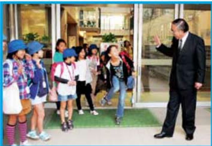
帰宅する児童を見送ります

毎週木曜日に、図書室で地域の読み聞かせボランティアグループによるお話会（ブックタイム）が行われています。低学年から高学年まで、ゆっくりと本を楽しむ時間です。この日は、区長が、紙芝居『なんにもせんじん』の読み聞かせに挑戦しました。評判は上々。楽しい物語に、子どもたちから笑い声があがっていました。