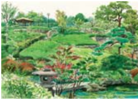
池田山公園 東五反田 5-4