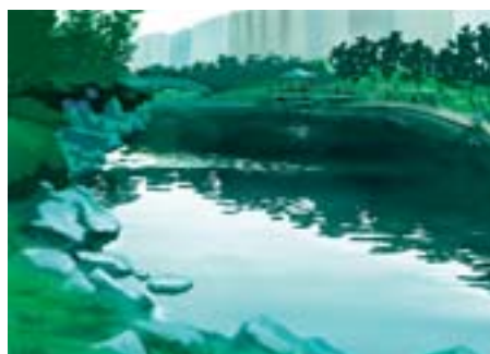
しながわ区民公園 勝島 3-2、南大井 2-3