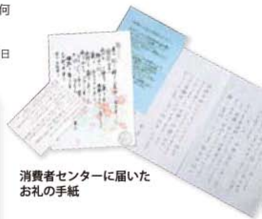
消費者センターに届いたお礼の手紙

私の外出中に、少し判断力が低下している夫が不要な消火器を購入してしまいました。しかもサイズが大きくて、私たち年寄りには重くて使えません。ふと消費者センターのことを思い出し、迷いながらも電話で相談してみました。すると相談員の方が業者に連絡を取ってくださり、返品することができました。相談してみて良かったです。(70歳代女性)