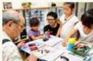
診療申込書に症状などを記入