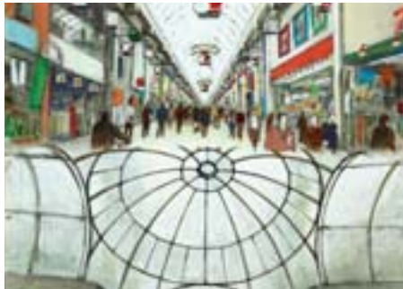
武蔵小山商店街のにぎわい 小山 3、荏原 3