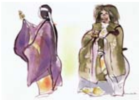
太大神楽 (品川神社) 北品川 3-7-15