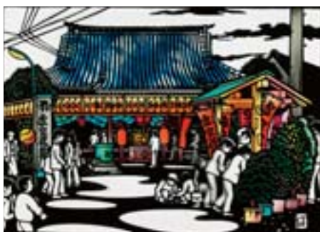
虚空蔵尊 (養願寺) の縁日 北品川 2-3-12