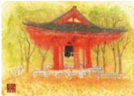
品川寺の梵鐘 南品川 3-5-17