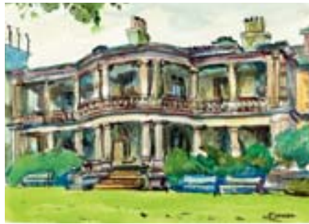
清泉女子大学 (旧島津公爵邸) 東五反田 3-16-21