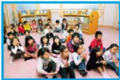
紙芝居のお話に聞き入る児童たち

息子4人が第二延山小学校でお世話になりまして、その恩返しができればと、すまいるスクールが始まった当初から、お手伝いさせていただいています。お作法もちろん大切ですが、お茶は相手への思いやりを学べる機会です。お茶をおいしく飲んでほしいと思う心が大切です。技術はつたなくとも、心がともなっていてほしいと伝えています。