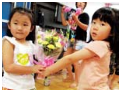
子ども審査員賞 元気だね