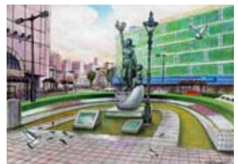
『平和の誓い』像 大井町駅南口前