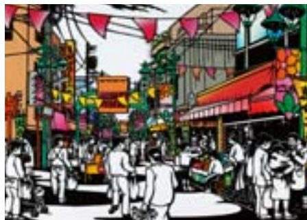
戸越銀座商店街のにぎわい 平塚 1~戸越 1、2