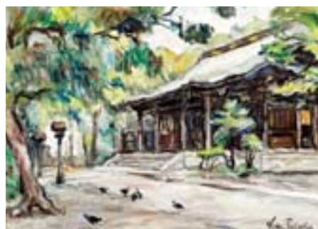
鹿島神社 大井 6-18-36