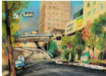
大崎ニューシティ 大崎 1-6