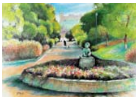
みなとが丘ふ頭公園 八潮 3-1