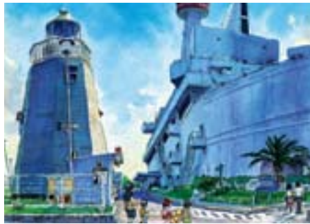
船の科学館からの眺め 東八潮 3-1