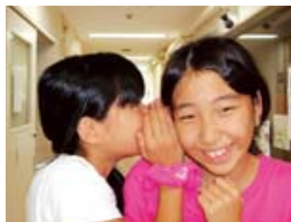
審査員賞 二人の秘密