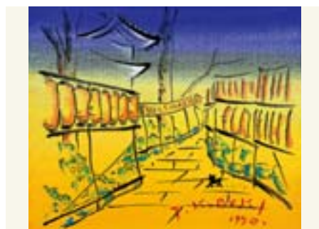
大仏の千灯供養 (養玉院) 西大井 5-22-25