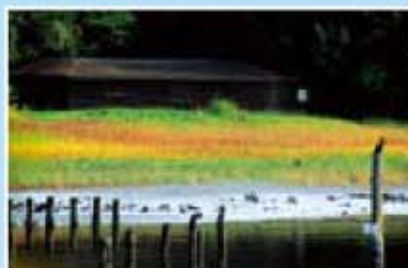
干潟と野鳥観察小屋

八潮4-2 / 問い合わせ なぎさの森管理事務所 TEL : 3799-0938