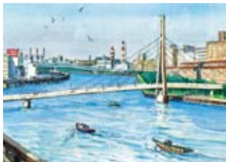
かもめ橋 八潮 5~勝島 1