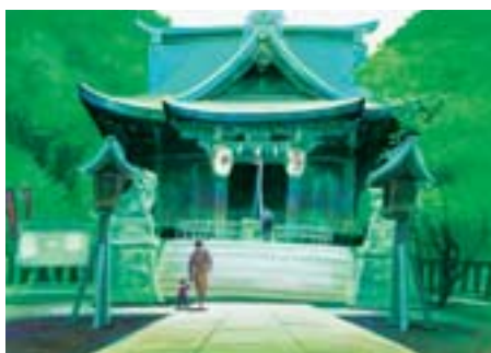
小山八幡神社 荏原 7-5-14