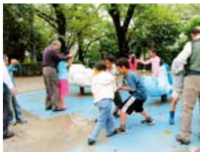
子ども審査員賞 たいせつなともだち