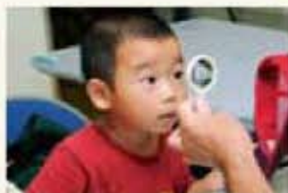
おもちゃの仕組みに興味津々