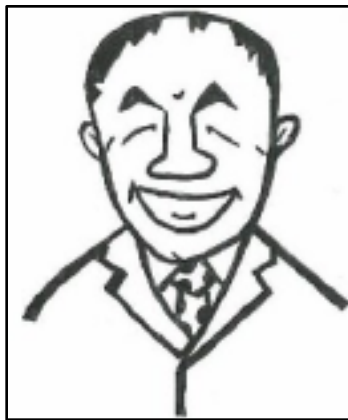
(イラストは吉田順先生)

この立派な児童・生徒が更に自己の資質・能力を高めて行けるよう、地域や保護者の皆様と力を合わせて、精一杯頑張っております。ご支援ご協力の程、どうぞよろしくお願いいたします。