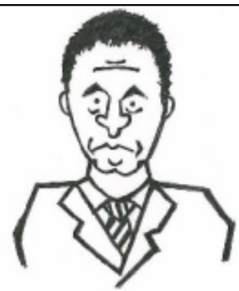
(イラストは吉田順先生)

伊藤学園は、地域の中の学校です。子どもたちが地域に愛着をもち、地域を大切に、将来、地域に貢献できるような児童・生徒を育てていけるよう、精一杯がんばってまいります。どうぞよろしくお願いいたします。