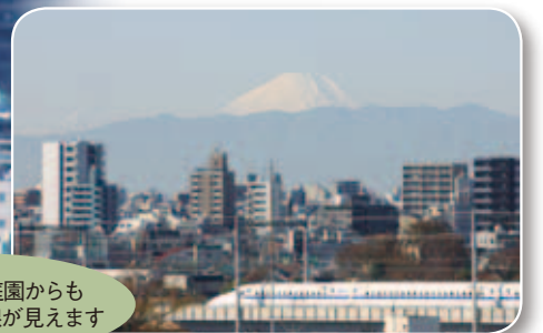
区役所屋上庭園からも富士山と新幹線が見えます