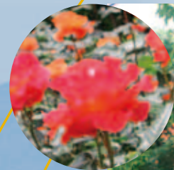
ねむの木の庭のバラ「プリンセス・ミチコ」