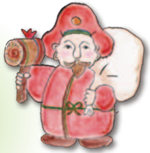
だいこく 大黒(国)天

ここでは七福神にまつわるお話をご紹介します。「しながわクロスワード」のヒントも隠れていますので、お見逃しなく！