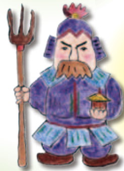
びしゃもんてん 毘沙門天

中国の長寿の神。南極星の化身と言われる。連れている鹿は、長寿をつかさどる神の使いとされる。