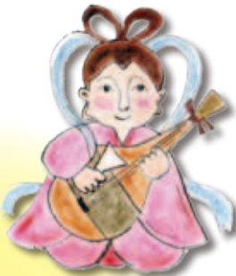
べんざいてん 弁財天

海上・漁業・商売の守り神。岩の上で鯛を釣り上げた姿で描かれることが多く、「エビス顔」で親しまれている。