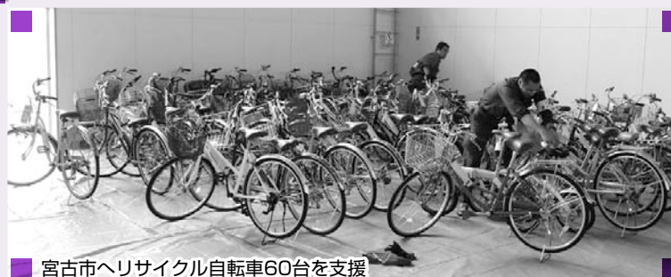
宮古市へリサイクル自転車60台を支援

区では、地震発生直後に災害対策本部を設置し対策にあたり、その後節電対策や放射能対策など状況の変化に応じた様々な対応と被災地支援を続けてきました。24年度も引き続き支援を行っていきます。