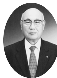
福島県富岡町長 遠藤勝也