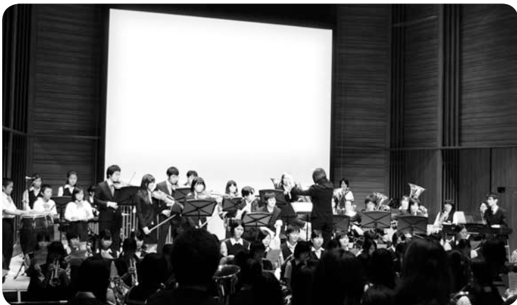
2011年品川区民芸術祭オープニング