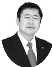
岩手県宮古市長 山本正徳

今日に至るまで、品川区の皆様から義援金、支援物資など多大なるご支援・励ましを頂戴しております。心より感謝申し上げます。