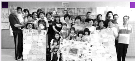
日光しながわ光林荘で生活された富岡町の皆さん