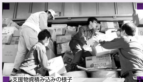
支援物資積み込みの様子

区では、地震発生直後に災害対策本部を設置し対策にあたり、その後節電対策や放射能対策など状況の変化に応じた様々な対応と被災地支援を続けてきました。24年度も引き続き支援を行っていきます。