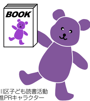
品川区子ども読書活動 推進PRキャラクター 「ブックマくん」

図書館では、「子ども読書の日」にちなんで様々な催しを開催します。ぜひ、お子さんと一緒にお近くの図書館へお出かけください。