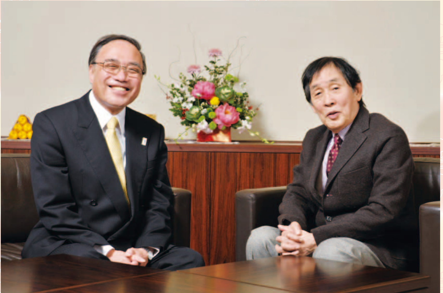
濱野 健 (品川区長)