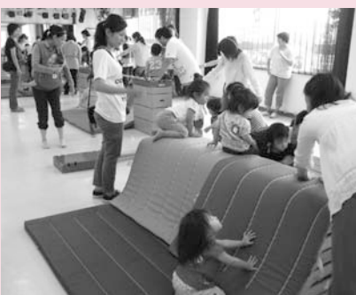
2～3歳児向けのクラブ

区内には25の児童センターがあり、徒歩圏内に点在しています。0歳児から利用できますので、気軽にお立ち寄りください。