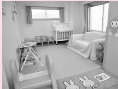
利用は月曜～土曜日の午前9時～午後6時まで

0～3歳くらいまでの乳幼児の親子向けのクラブです。年齢別で分かれ、外に出られるようになった赤ちゃんから登録・参加できます。体操やリズム遊び、工作、クッキングなどを通して親子で楽しい時間を過ごすのはもちろん、同じ年齢のお子さんを持つ仲間と知り合う機会にもなり、保護者同士の交流のひろばにもなっています。