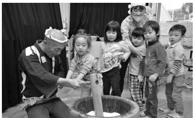
季節の行事「おもちつき」