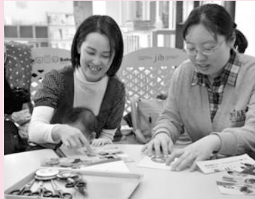
オリジナルの缶バッチづくり

乳幼児の保護者を対象にものでづくりやお話し会、季節の行事など、各館それぞれ工夫を凝らしたプログラムを用意しています。お子さんを遊ばせながら楽しめる内容で、お父さん・お母さんたちの交流や情報交換、仲間づくりのできる場ともなっています。