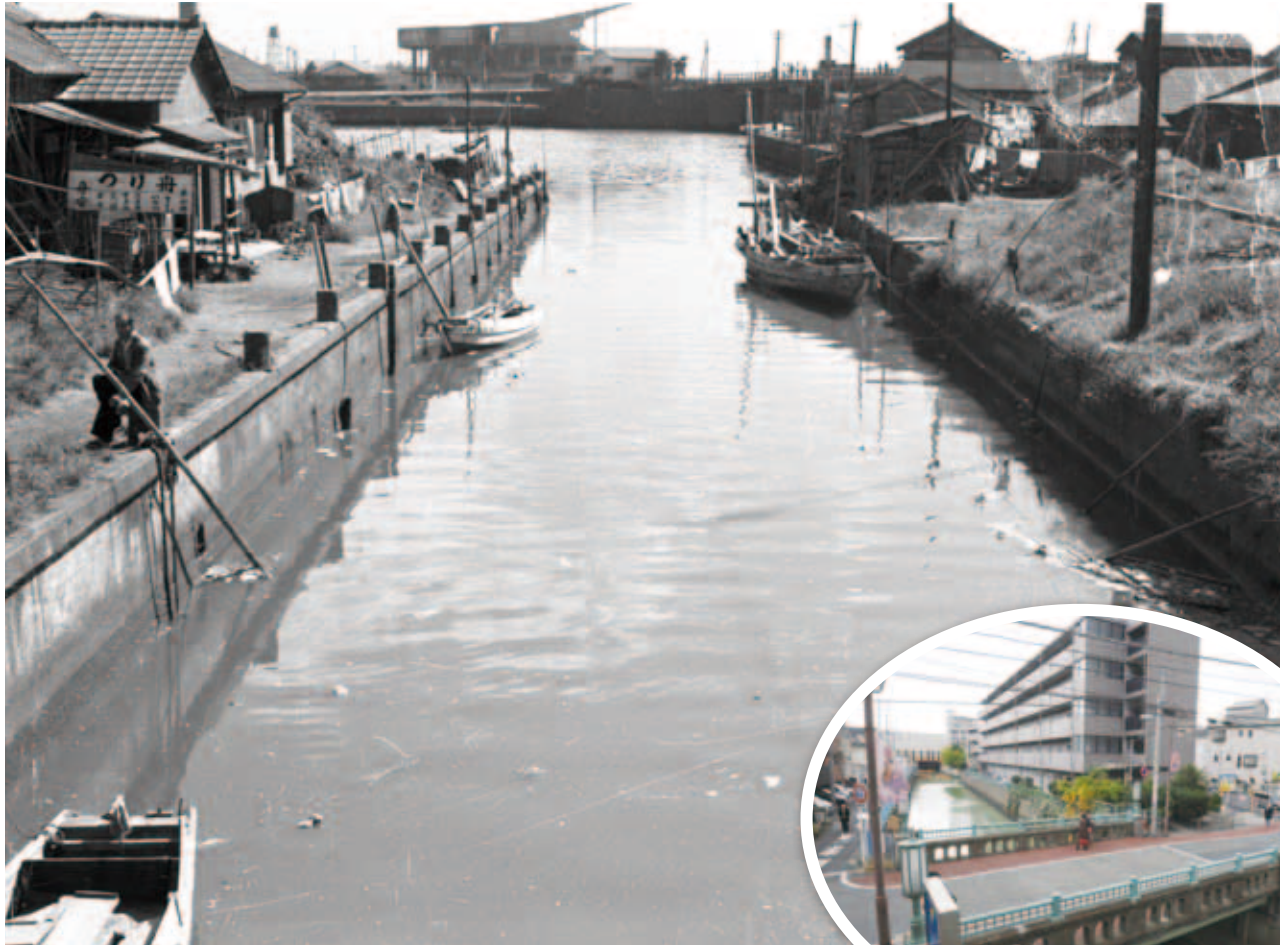
なみだ橋から見た勝島運河方面 (昭和30年(1955)撮影)