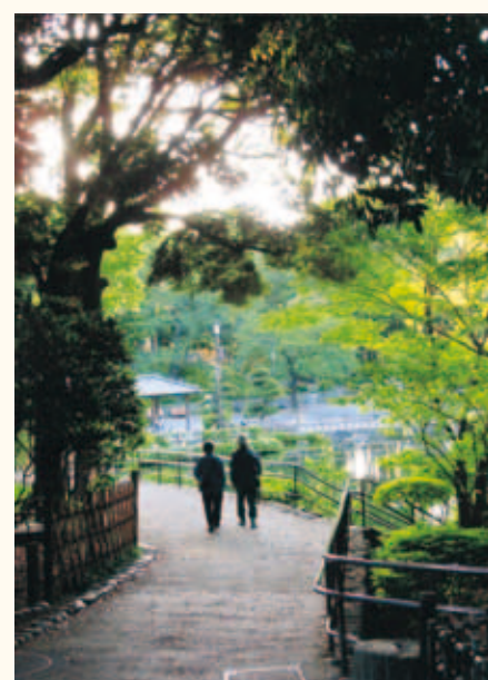
花と緑の公園賞 高橋哲夫「都会のオアシス」 しながわ区民公園 (勝島3-2、南大井2-3)