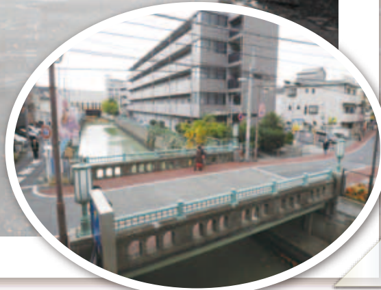
現在のなみだ橋 (平成24年(2012)12月撮影)