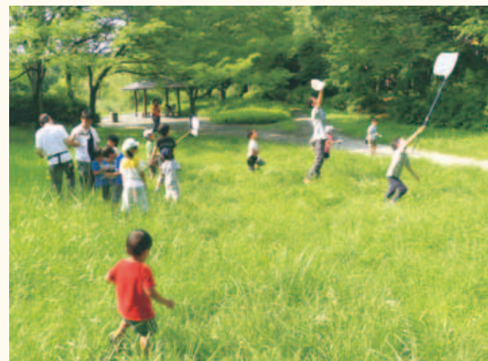
スマイルキッズ賞 武藤紀子「とんぼとり」 みなとが丘公園 (八潮3-1)