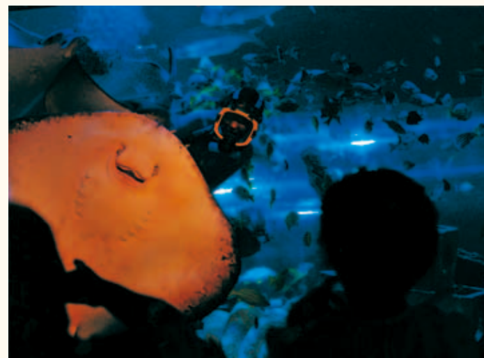
しながわ水族館賞 田口直生「笑ってるよ」 しながわ水族館 (勝島3-2-1)