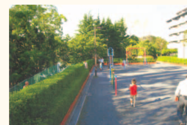
入選 岩垂迪夫「憩いを求めて」 戸越公園 (豊町2-1)