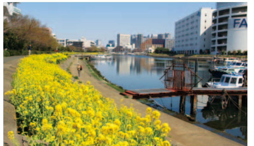
菜の花が満開のしながわ花海道 (平成24年(2012)4月撮影)