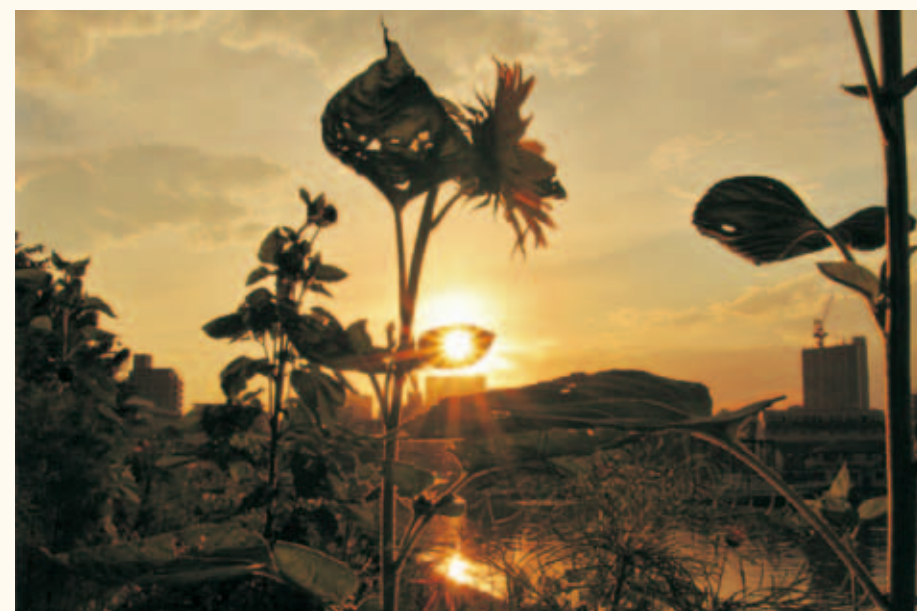
フォトアート賞 鈴木広子「含み笑い」 しながわ花海道 (東大井1・2、勝島1)