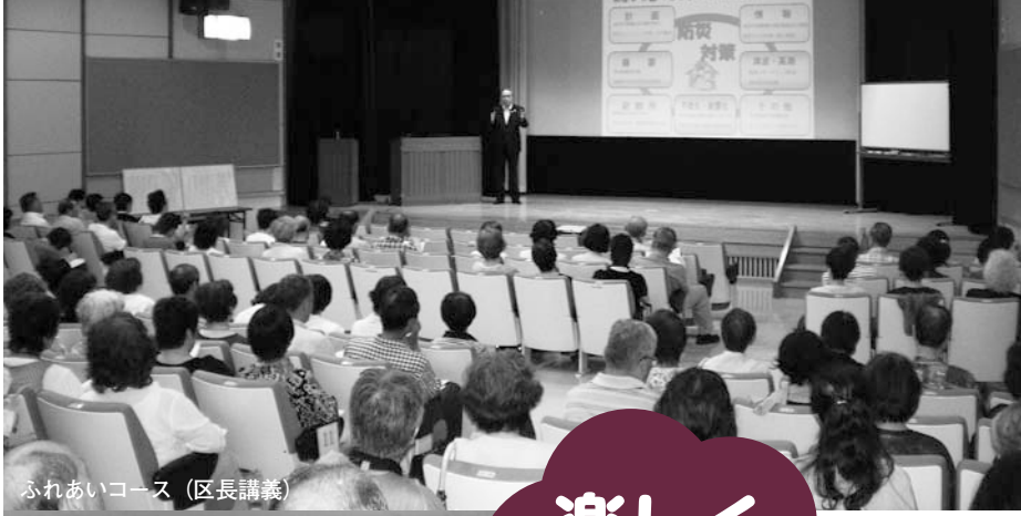
ふれあいコース (区長講義)

☎140-8715 品川区広町2-1-36 代表番号 ☎3777-1111 広報広聴課 ☎5742-6644 Fax5742-6870 http://www.city.shinagawa.tokyo.jp/