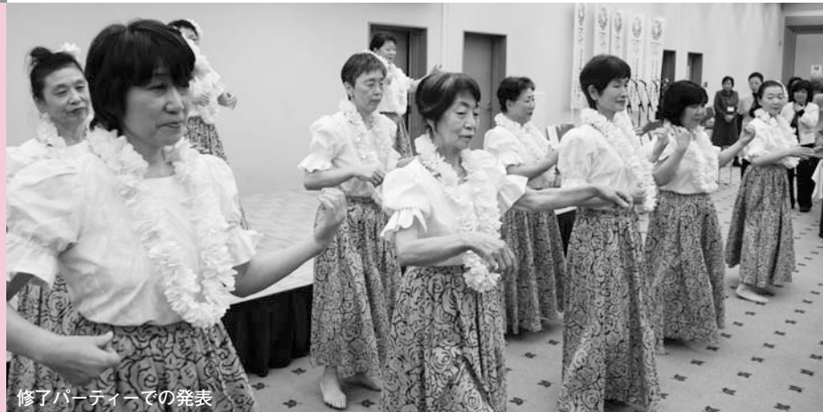
修了パーティーでの発表

●講座や会場の案内などを掲載した「入学案内」は文化スポーツ振興課、地域センター、文化センター、シルバーセンターなどで配布しています