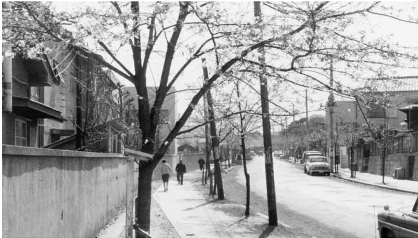
歩道が新設され植樹された桜(昭和36年(1961)4月撮影)