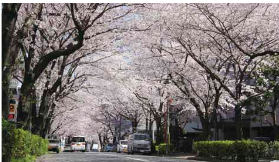
かむろ坂上から見た桜並木(平成24年(2012)4月撮影)