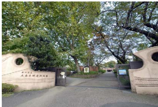
大森貝塚遺跡庭園