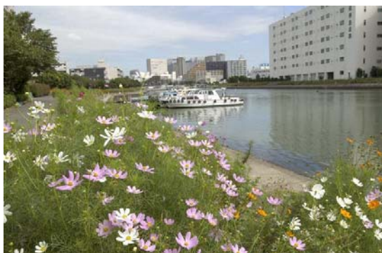
コスモスが咲くしながわ花海道

水辺景観形成特別地区や運河、目黒川、立会川等の水辺については、水辺に面したオープンスペースの設置や植栽等を活かした親水空間の整備、水辺からの眺望に配慮した景観形成を進めていく。