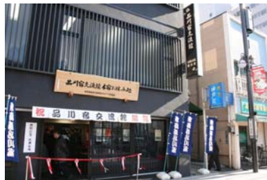
品川交流館本宿お休み処