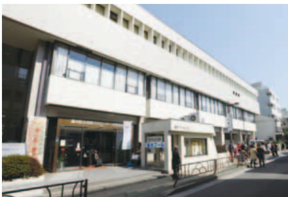
荏原文化センター(平成25年(2013)3月撮影)