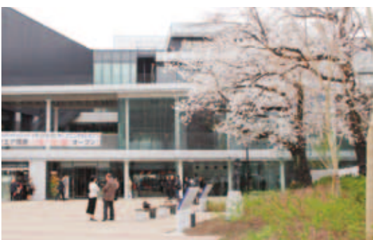
スクエア荏原(平成25年(2013)3月撮影)