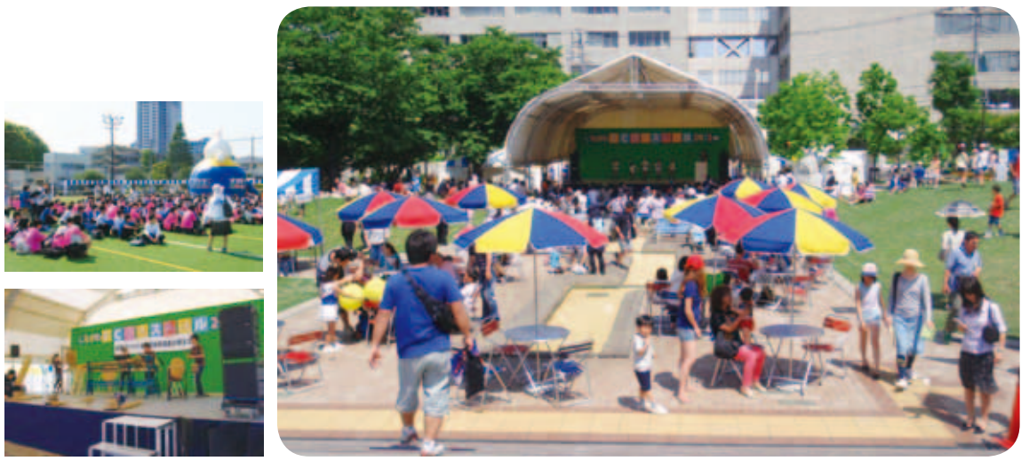
ウルトラマン×らんま先生 エコサイエンスパフォーマンス

●ごみの中からこんなもの展 ごみとして収集した物で、まだ使える物を抽選でプレゼントします。