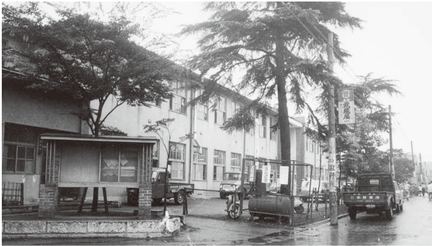
中延1丁目の荏原支所(昭和36年(1961)8月撮影)