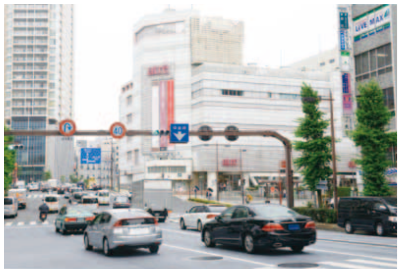
現在の様子(平成25年(2013)7月撮影)