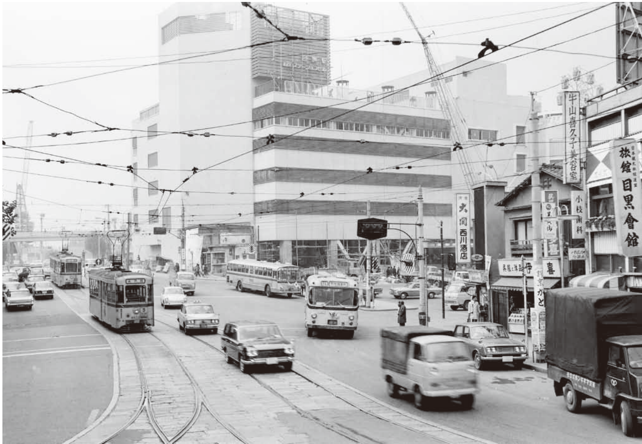
永代橋行きの都電が走る(昭和42年(1967)撮影)