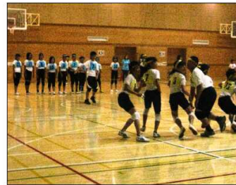
上 試合中コート駆け回る 右 熱戦のあいだの休み

大会当日まで持っていく大人たちは大変ですが、試合そのものを作り上げていく子供たちを見てみると、来年もいい舞台を作ってあげようと、また更に意気込んでしまいます。(´▽`)