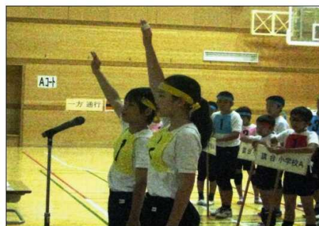
選手宣誓 正々堂々頑張ります