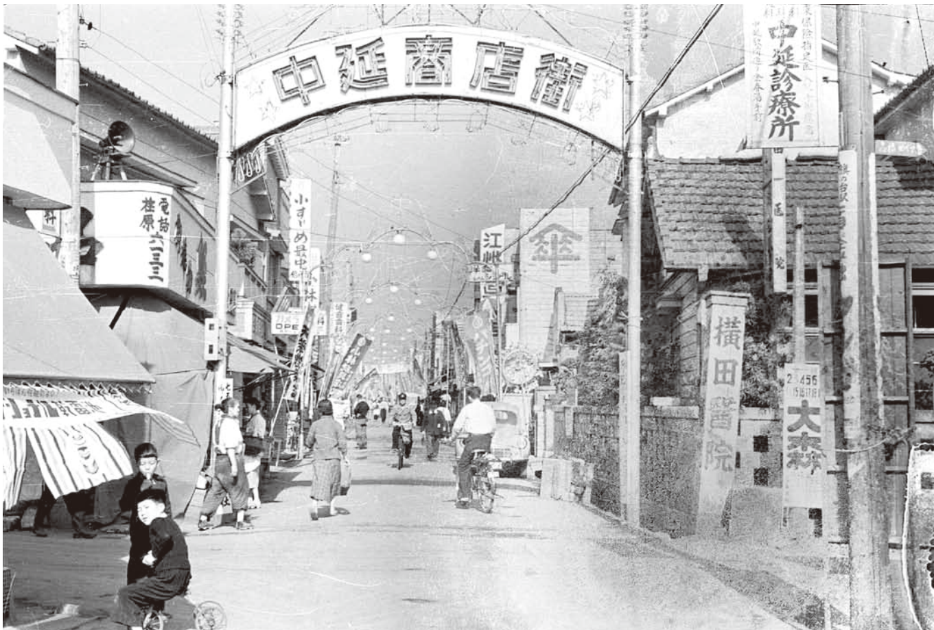
中延駅側商店街入り口 (昭和29年(1954) 11月撮影)