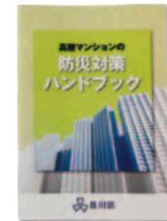
(マンション居住者向け)