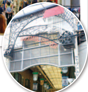
アーケード入り口 (平成25年(2013) 7月撮影)