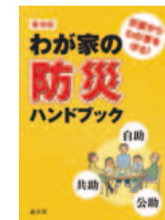
※3月に全戸配布しました。

防災課(第二庁舎4階)で配布しています ※区ホームページからもご覧いただけます。