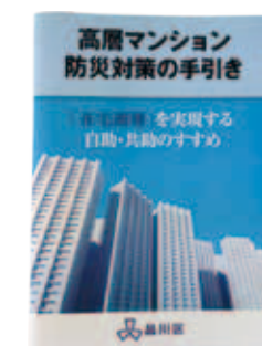
(管理組合の方向向け)