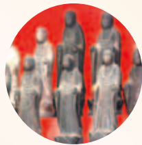
千本仏 (長野県須坂市 萬龍寺)