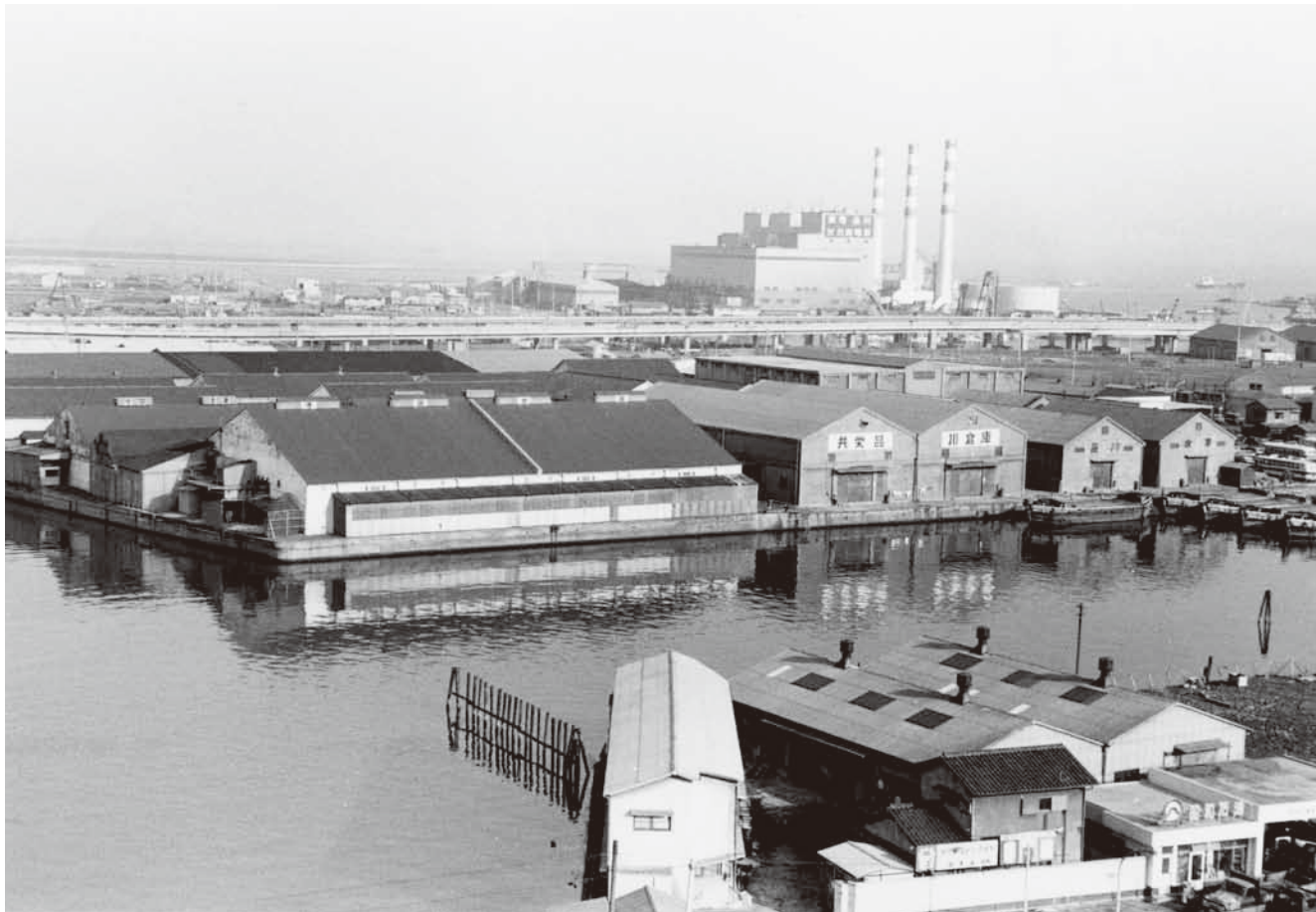
天王洲橋から見た天王洲の倉庫街（昭和41年（1966）撮影）