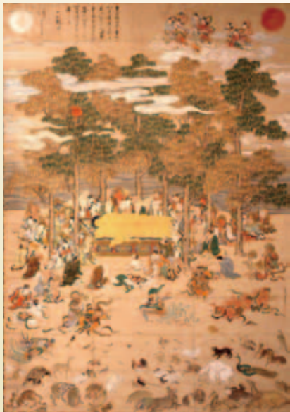
涅槃図 (東京都指定文化財)

休館日/月曜日(10月14日、11月4日は開館) 10月15日(火)、11月5日(火) 観覧料/300円、小・中学生100円 ※20人以上の団体は2割引。70歳以上の方、障 害のある方、品川区立学校の小・中学生は無料。 ※10月8日(火)～12日(土)、12月3日(火)～6日(金)は、 展示替えのため臨時休館。