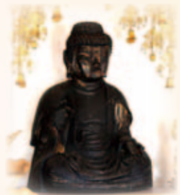
木造阿弥陀如来坐像 (長野県駒ヶ根市 安性寺)