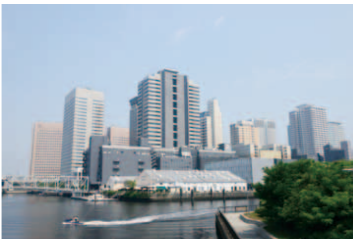
手前は天王洲運河水辺広場（平成25年（2013）8月撮影）