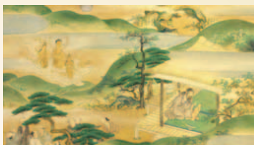
弾誓上人絵詞伝 (箱根町 阿弥陀寺、箱根町指定文化財) 但唱の師、弾誓の作仏風景

福祉ショップ「シンフォニー」特製 「養玉院如来寺クッキー・パウン ドケーキ」販売