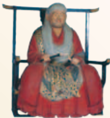
木造天海僧正坐像 (品川区指定文化財)