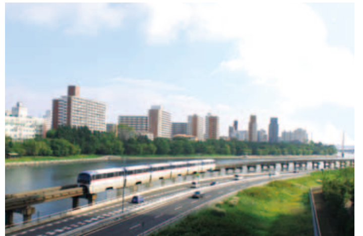
八潮橋から撮影 (平成25年(2013)10月撮影)