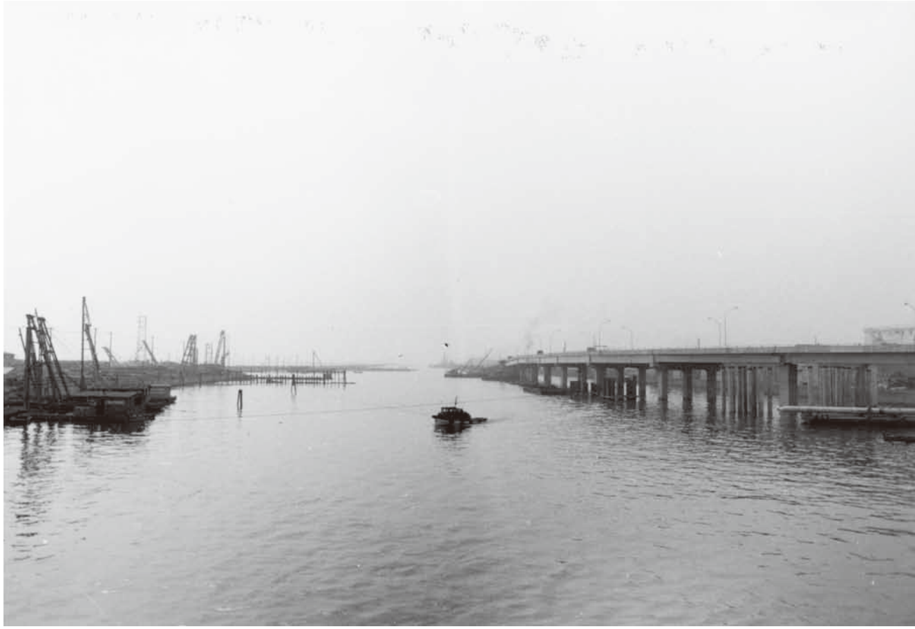
埋め立て工事が進む大井ふ頭(左) (昭和38年(1963)撮影)