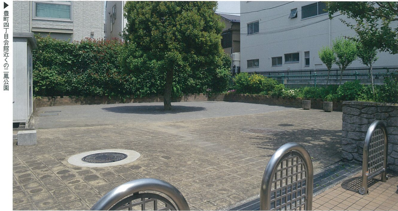
豊町四丁目会館近くの二鳳公園