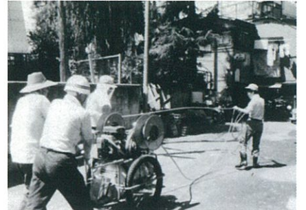
殺虫剤散布(昭和59年7月22日)