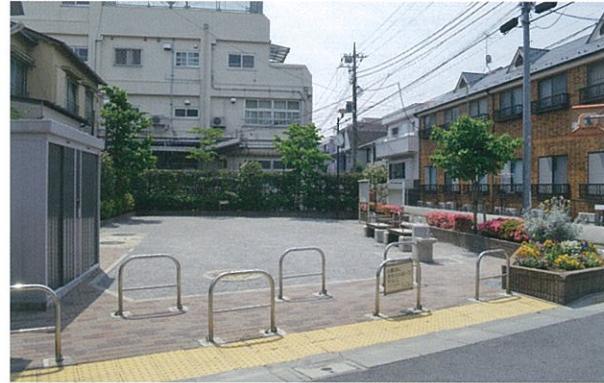
豊四中央防災広場