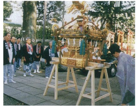
御魂入れ(平成13年7月15日)