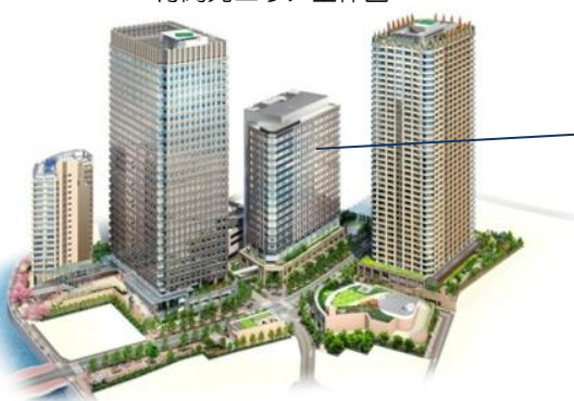
再開発エリア全体図