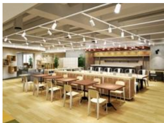
オープンラウンジ①