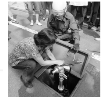
スタンドパイプを使った初期消火訓練

災害時は初期消火が最も重要だと考え、7つの防災エリアごとにスタンドパイプを設置しました。各エリアでの訓練を反復することで、参加者全員が操作できるようになり、また参加者同士の交流も深まりました。