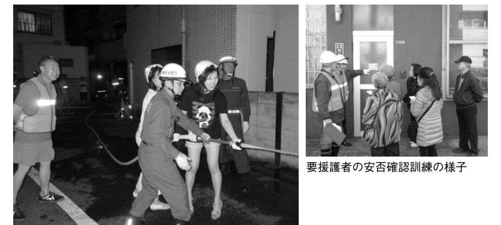
防災ボランティアの要望で夜間訓練を実施

町会活動とは別に、地域で防災活動ができる「防災ボランティア」を募りました。現在では、各エリアで5人程度の防災ボランティアが中心となって、訓練が行えるようになりました。災害時要援護者への支援も自発的に行うようになってきています。