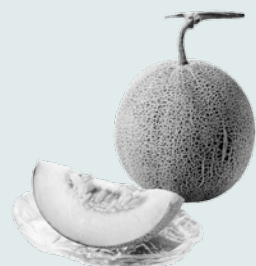
「大井」種のマスクメロン（平成24年栽培・撮影）

昨年刊行した『品川区史2014』の内容を紹介するシリーズです。品川の歴史にふれてみませんか。