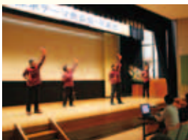
探求テーマ発表会より