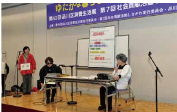
消費者センター相談員による寸劇も好評でした。

2月14日（土）15日（日）の2日間にわたり「ゆたかな暮らし、つながる地域」をテーマに社会貢献活動しながらと合同で開催し、4,409名の方に、ご来場いただきました。