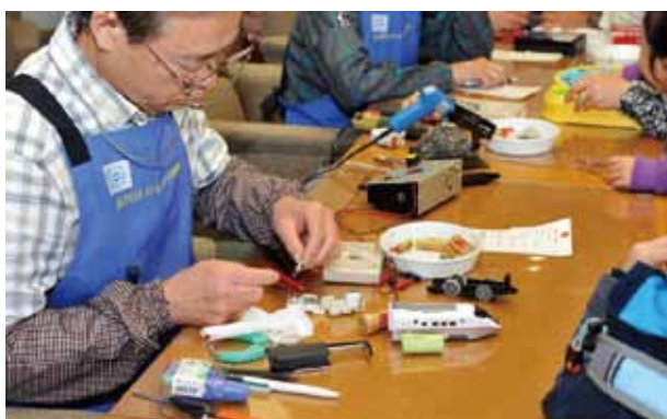
おもちゃの病院も大盛況でした。