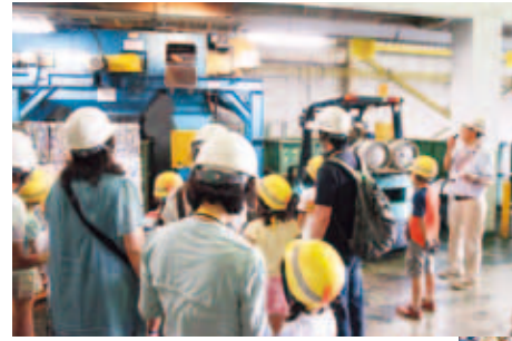
プレスされたアルミ缶