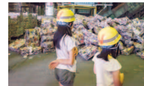
県内外各地から届いた殺菌処理前のアルミ缶

静岡県駿東郡のアルミ缶の再生工場で、プレス処理された空き缶が再生アルミ地金になるまでの工程を見学しました。